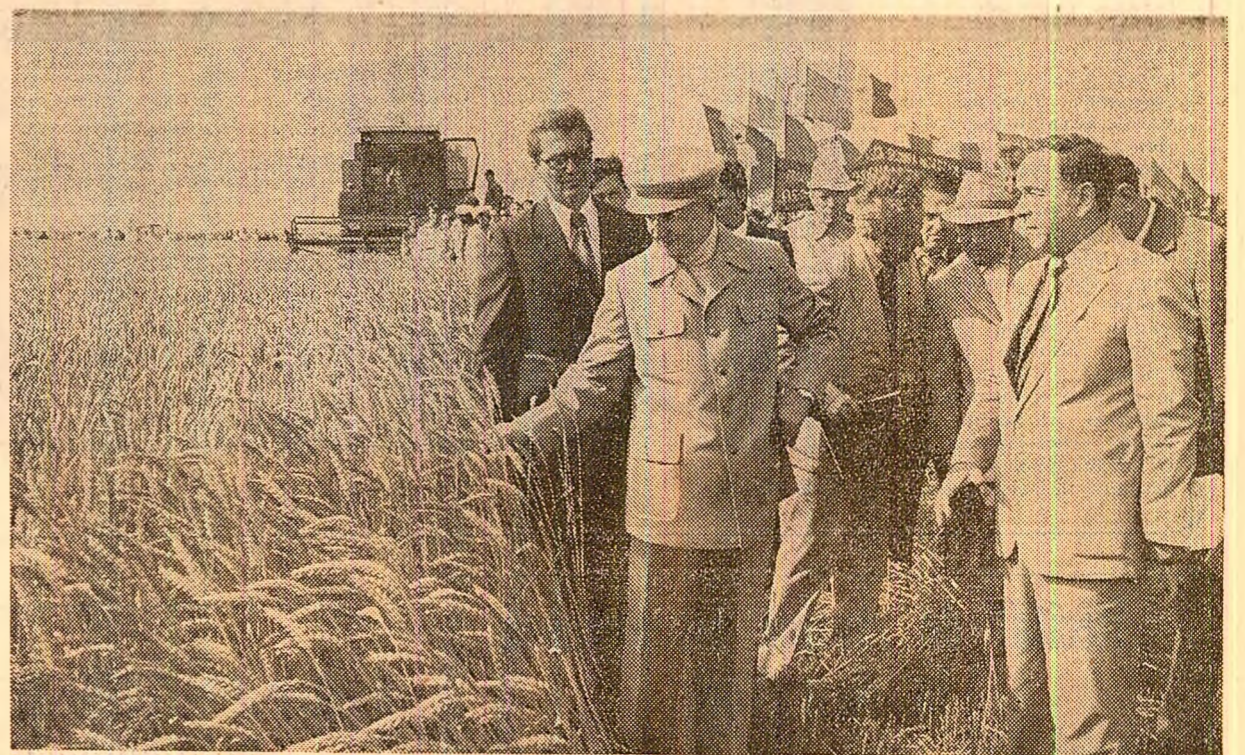
La cooperativa agricolă de producție „23 August”