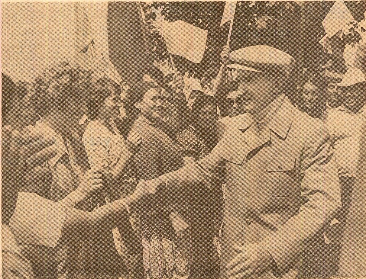
Prețutîndeni pe meleagurile dobrojene, oamenii ogoarelor au făcut o caldă primire secretarului general al partidului