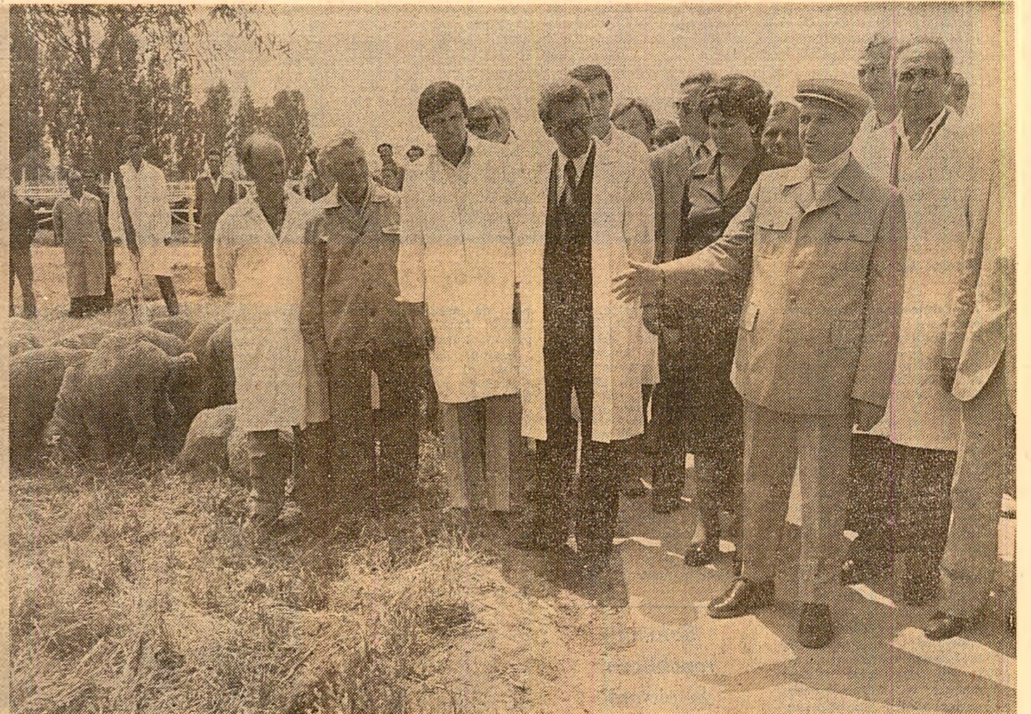
În timpul vizitei la ferma zootehnică din Cobadin