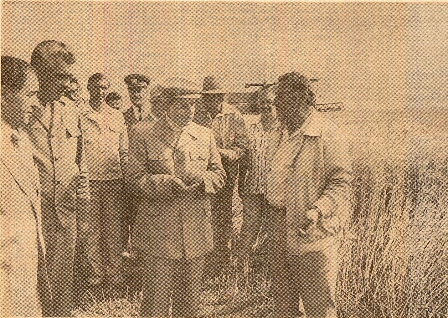
În momentul recoltării grâului, la cooperativa agricolă de producție din Plopeni