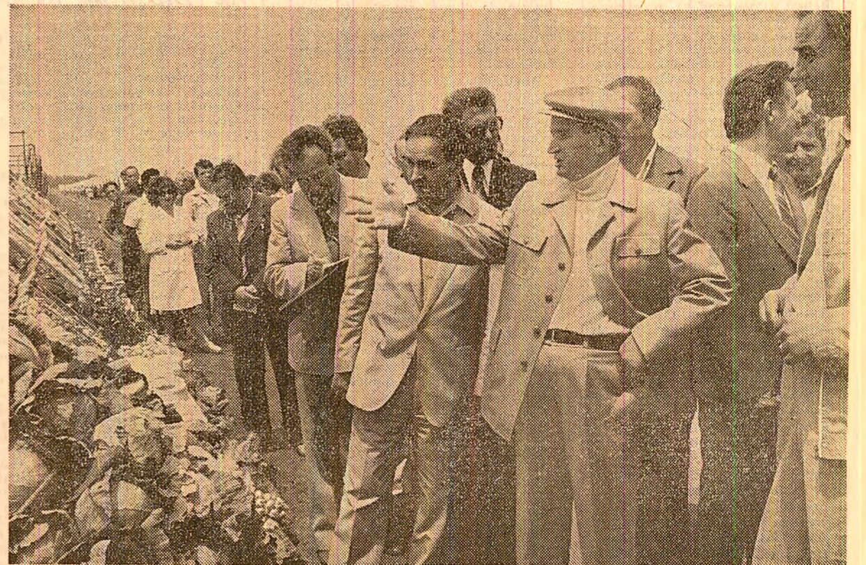
La asociația intercooperatistă din Cobadin sînt prezentate produse din noua recoltă