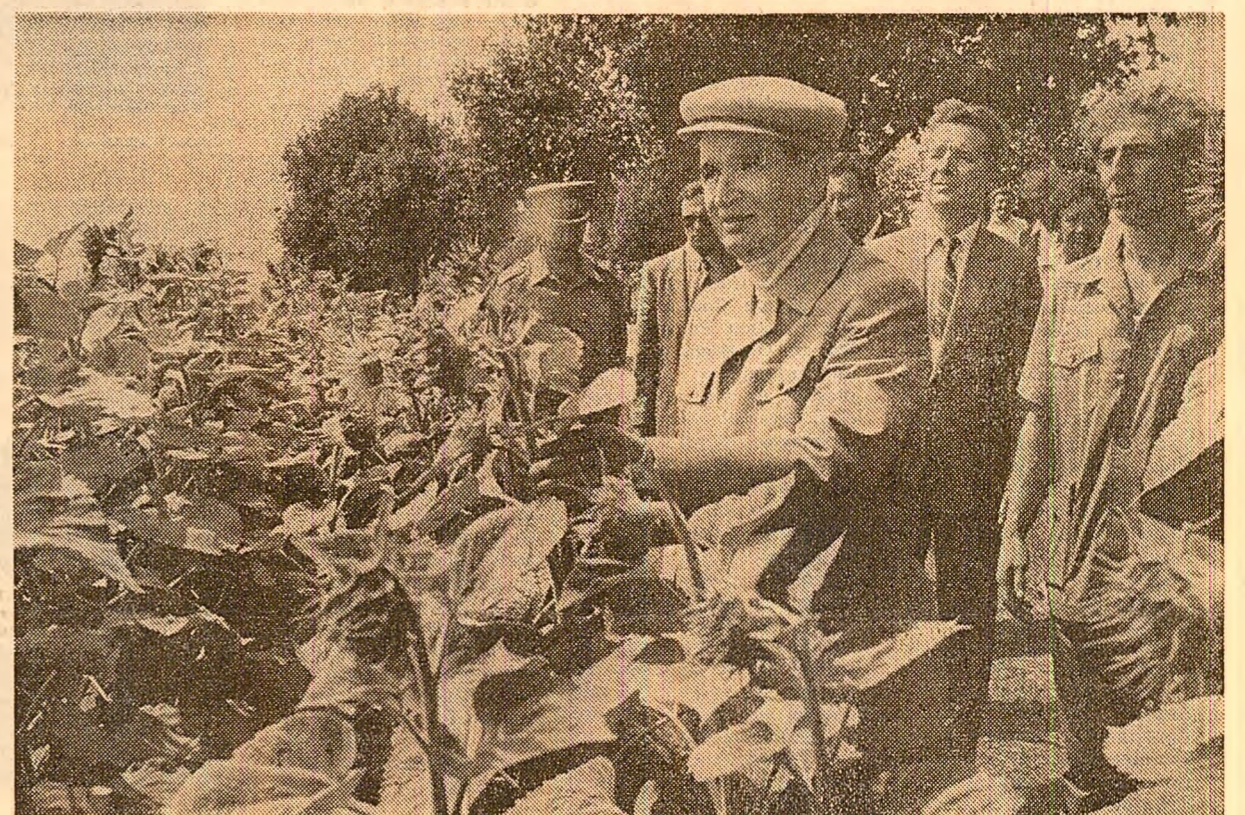
În comuna Cogealac se vizitează una din solele cultivate cu floarea-soarelui

Reprezentanții organelor locale de partid și de stat mulțumesc încă o dată tovarășului Nicolae Ceaușescu pentru vizita efectuată în județul lor și îl asigură că organele și organizațiile de partid, comuniste, toți oamenii muncii din agricultura vor acționa în spiritul indicațiilor, și sarcinilor trasate în timpul acestui nou dialog de lucru pentru îndeplinirea obiectivelor mobilizatoare pe care agricultura dobrogeană le are.