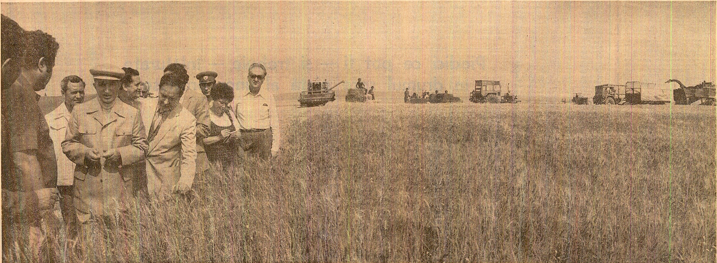
La Dorobanțu, în lanurile de grîu