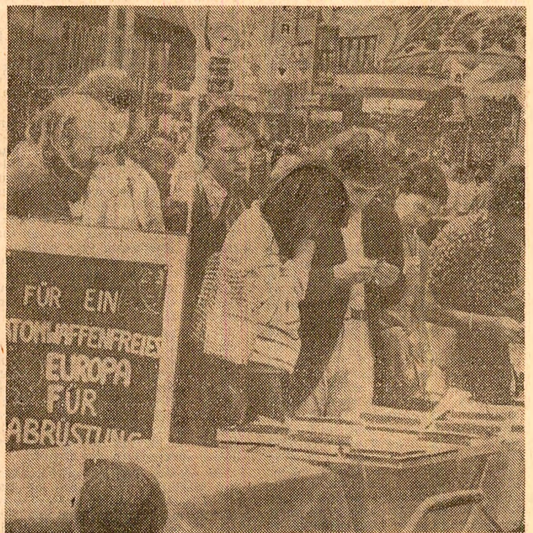
Din inițiativa organizației democratice de femei, la Dortmund (R.F.G.) s-a desfășurat o amplă campanie în rândul locuitorilor orașului în sprijinul dezarmării...