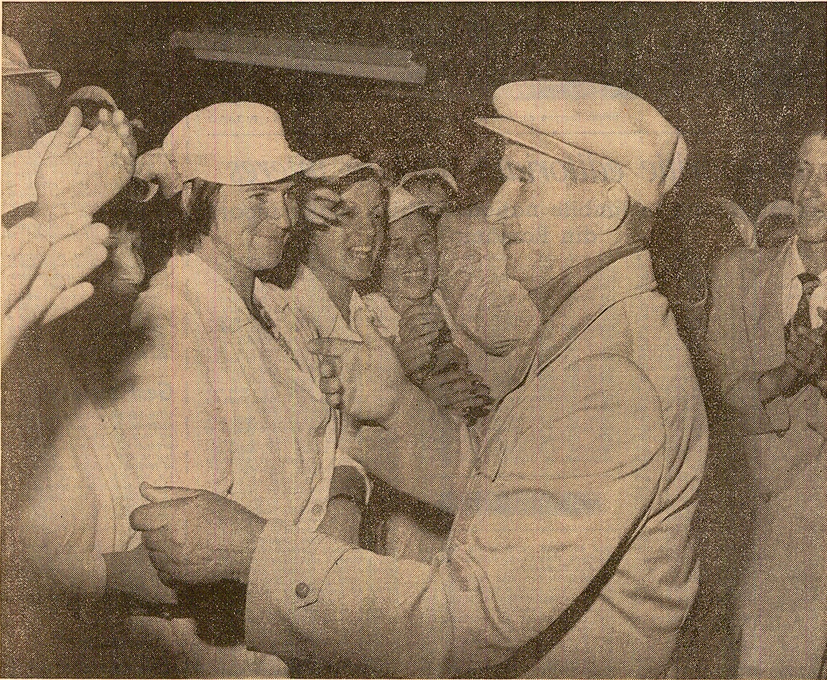
În mijlocul tinerului colectiv al întreprinderii „Electro-Argeș”

În unități industriale și agricole din județul Argeș