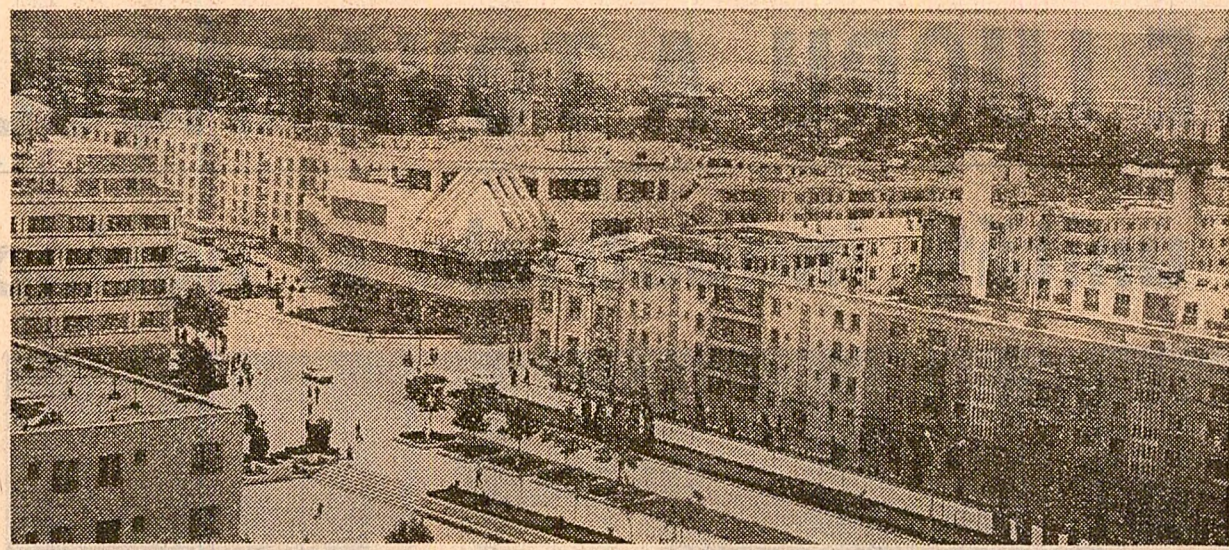
Birlad. Imagine din centrul municipiului