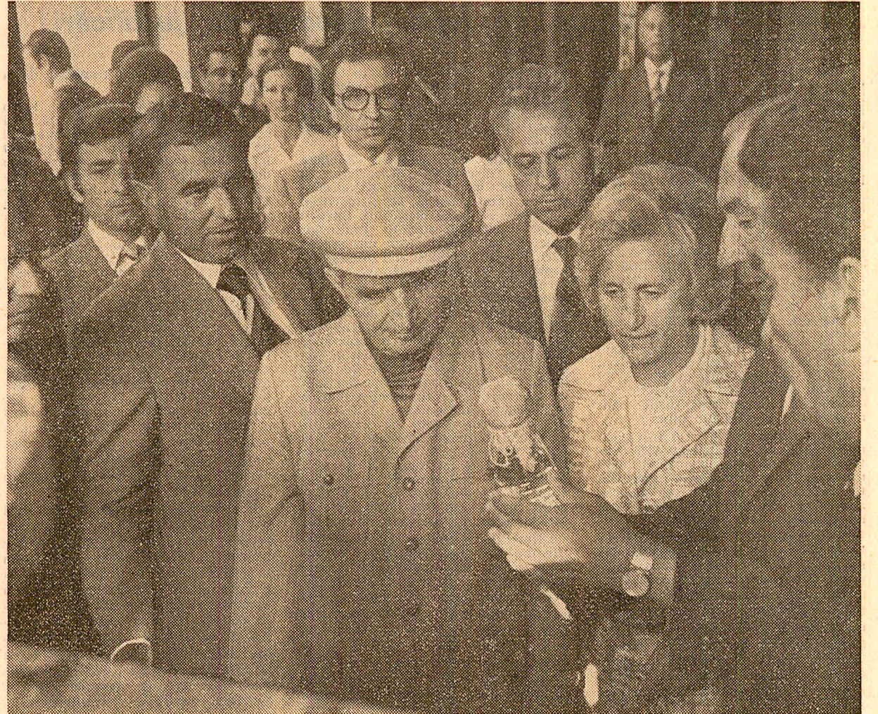
Sunt prezentate produse ale întreprinderii de bioproteine