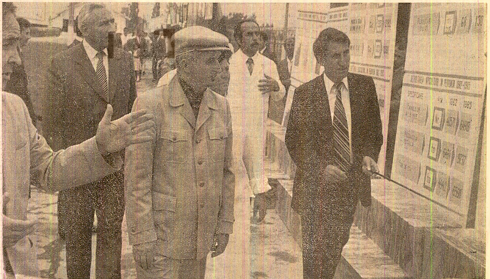
Secretarul general al partidului este informat asupra realizărilor obținute de I.A.S. Câteasca