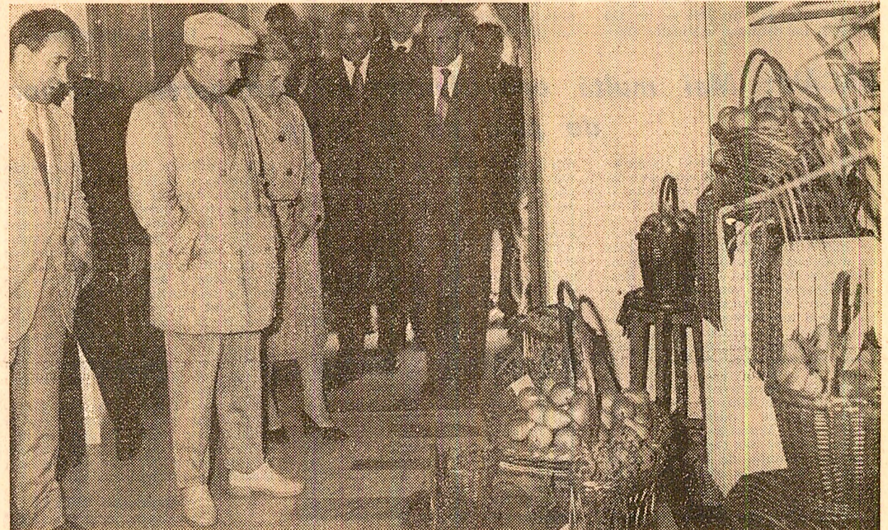
La Institutul național de cercetare și producție pomicolă de la Mărăcineni sint expuse fructe din noua recoltă