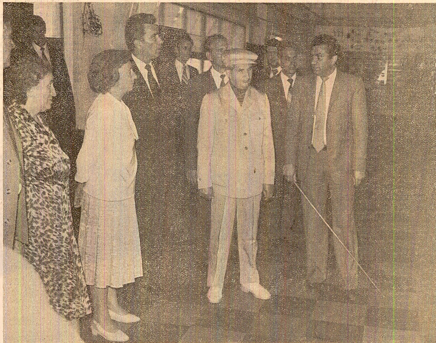
La Combinatul de fibre sintetice din Cimpulung