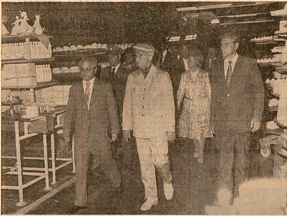
La Întreprinderea de porțelan din Curtea de Argeș