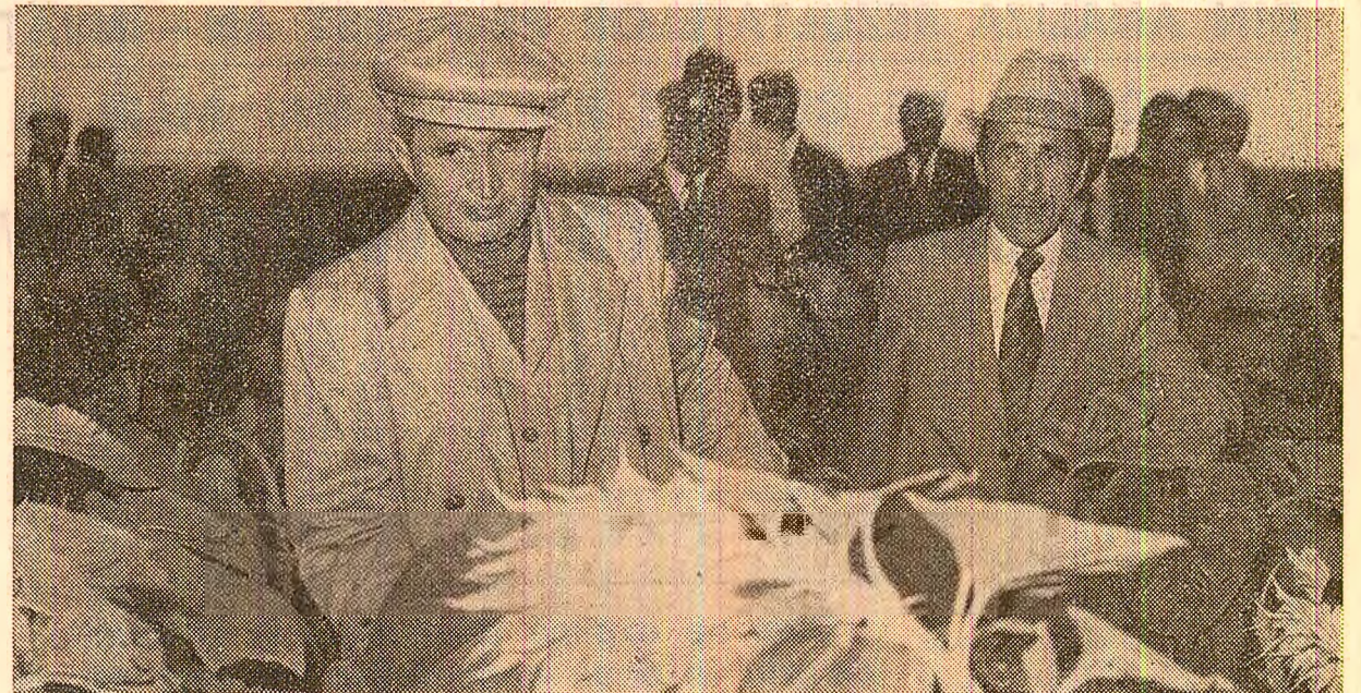
În lanurile cooperativei agricole de producție din Ungheni