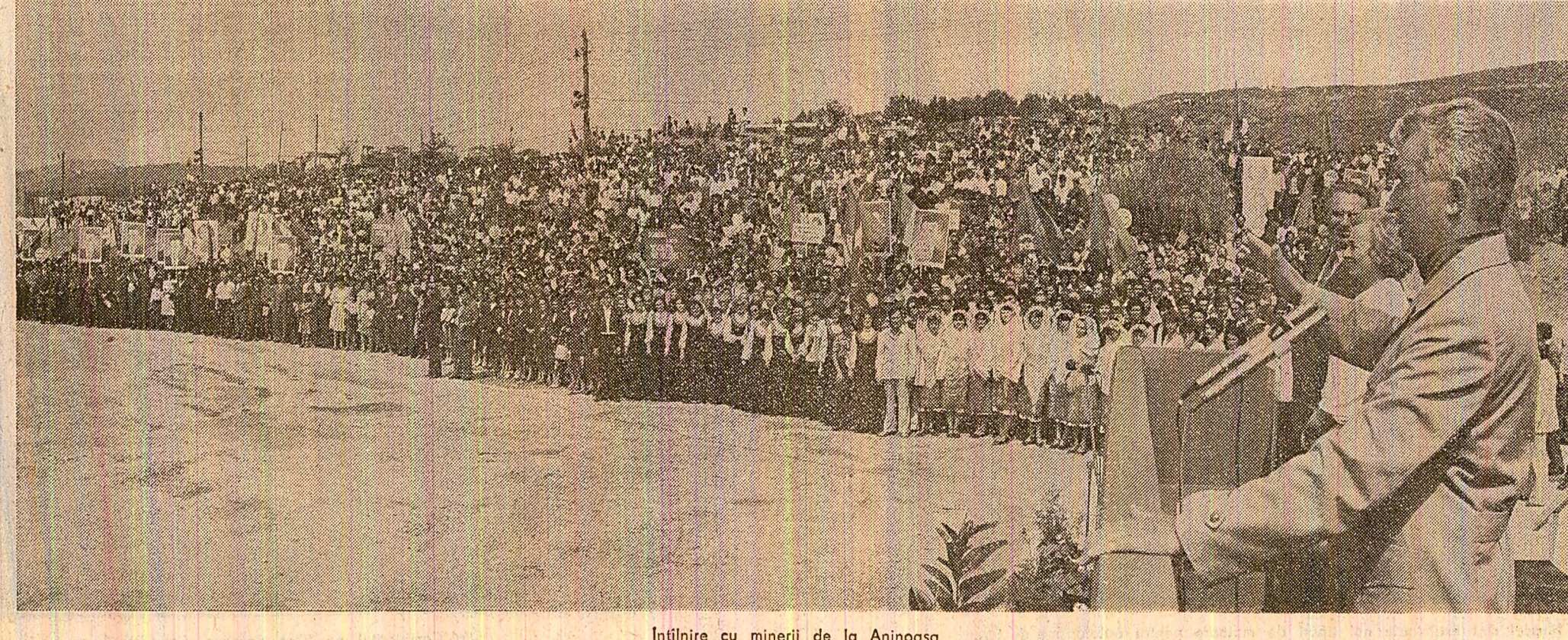
Întîlnire cu minerii de la Aninoasa

La sosirea în COMBINATUL DE FIBRE SINTETICE , tovarășul Nicolae Ceaușescu, tovarășa Elena Ceaușescu au fost întâmpinați de ministrul industriei chimice, de