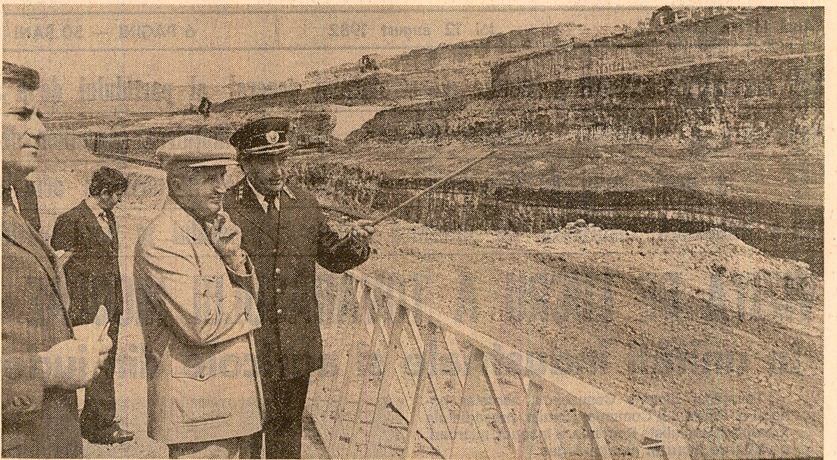
În Cariera de la Aninoasa