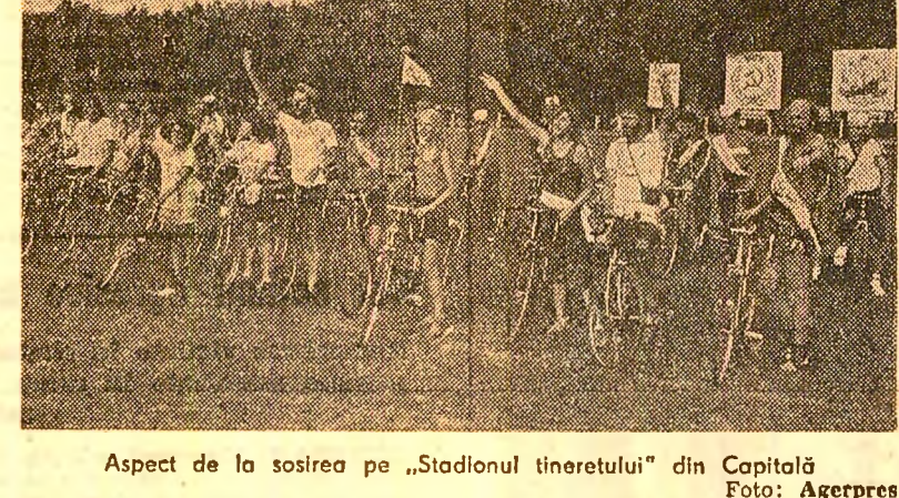
Aspect de la sosirea pe „Stadionul tineretului” din Capitală.