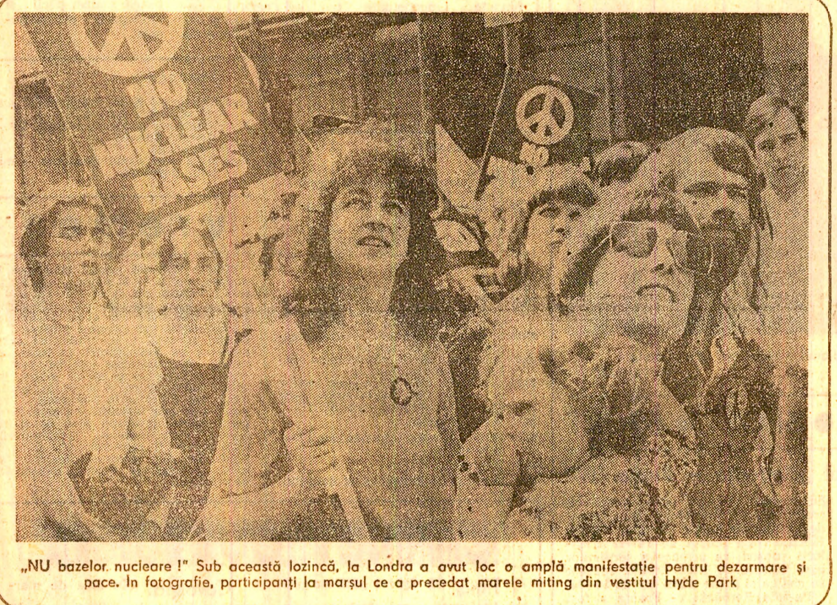
„NU bazelor nucleare!” Sub această lozincă, la Londra a avut loc o amplă manifestație pentru dezarmare și pace. În fotografia, participanți la marșul ce a precedat marșul din vestitul Hyde Park

Pe de altă parte, precizează agenția citată, forțele israeliene au expulzat aproximativ 1.400 de familii palestinienilor din tabăra Moyeh Wa Miyeh, forțându-le să se adăpostească în suburbii orașului Saïda, agravînd și mai mult situația populației refugiate. Tabăra a fost apoi distrusă.