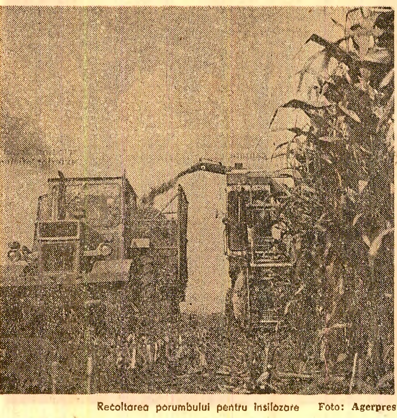
Recoltarea porumbului pentru silozură.

spațiilor necesare depozitării recoltei și altele. Totește acestea se constituie în învățăminte care se concretizează în măsuri, astfel ca semnalul declanșării amplei campanii de toamnă să găsească unitățile agricole, mecanizatorii, specialiștii, tîrîmii cooperatori gata pregătii pentru marșul asalt al lanurilor. Cum stau lucrurile, din acest punct de vedere, în unitățile agricole ale județului Călărași?