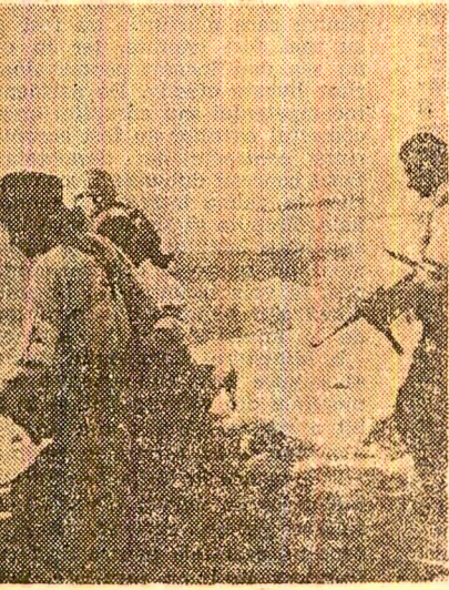
Formațiune patriotică de luptă din Capitală în acțiune în zilele lui august

dezvoltăm activitatea găzilor muncitorești, a unităților de pregătire militară a tineretului, să organizăm apărarea teritorială”, lată de ce, conștient de efortul susținut pentru realizarea exemplară, la parametrii noi calitativi, superioare a obiectivelor dezvoltării economice-sociale a României, combatanții găzilor patrioțici nu precupețesc nici un efort în vederea perfecționării continue a pregătirii lor de luptă, politico-educative și pentru acțiune, corespunzător exigențelor izvorite din hotărârile de partid, din Directiva comandantului nostru suprem. O concludență dovedă a nivelului ridicat de pregătire în vederea apărării patriei o constituie, fără îndoială, calificativul general de foarte bine cu care au fost apreciate, în cadrul recenziei controlate de fond, gările patriotice din sectoarele Capitalei și dintr-un însemnat număr de județe. De asemenea, gările patriotice și-a etalat și în etalează înaltele virtuți moral-politice și capacitatea de acțiune într-un sir de aplicații tactice desfășurate împreună cu unitățile militare și cu celelalte formațiuni populare, vînd îndeosebi apărarea localităților și a obiectivelor importante, precum și prin participarea activă la realizarea unor lucrări hidrotenionice și de îmbunătățiri funciare, la prevenirea incendiilor, în lăturarea efectelor calamităților naturale, asigurarea ordinii și liniștii publice, a pazei și apărării frontierei de stat.