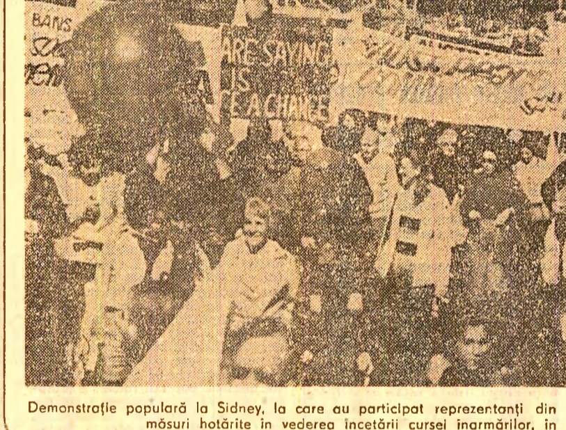
Demonstrație populară la Sidney, la care au participat reprezentanți din toate regiunile țării...