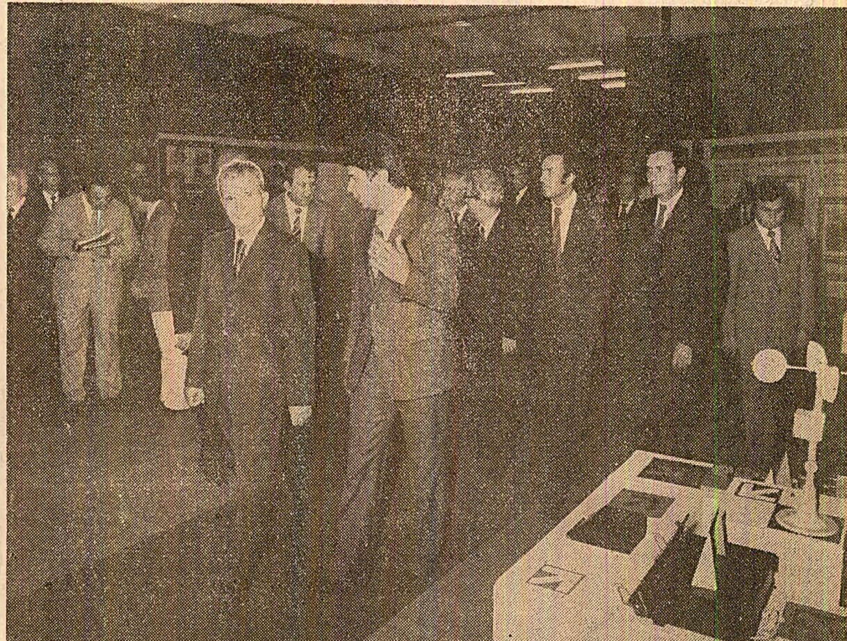
Momente din timpul vizitei la Institutul agronomic și la Institutul politehnic