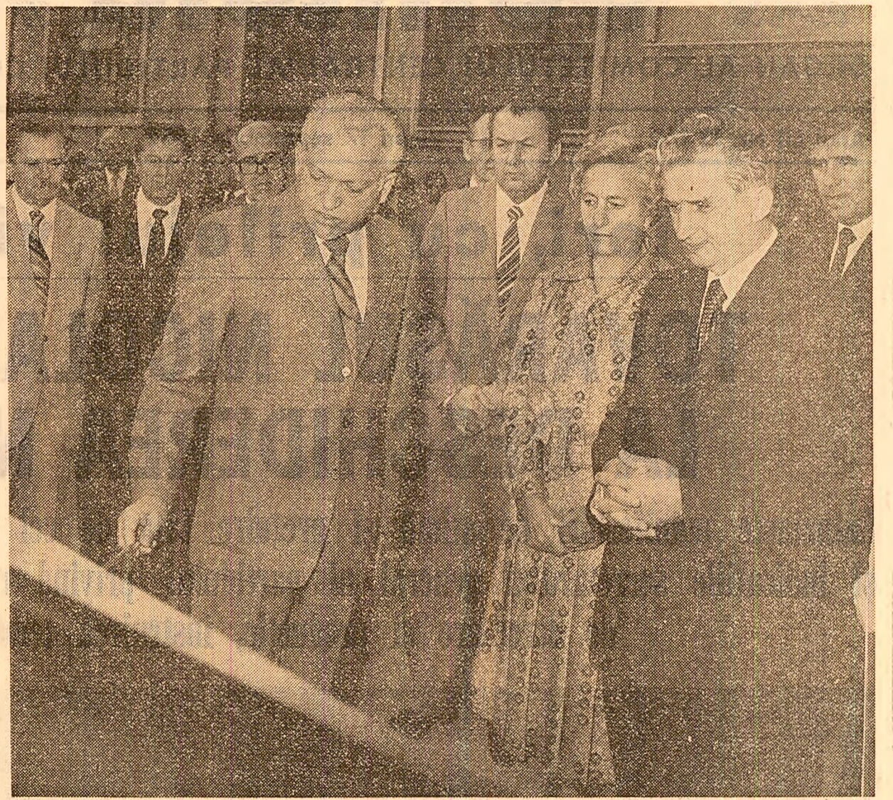
Sînt prezentate cele mai noi realizări ale Institutului central de cercetări metalurgice

La sfîrșitul vizitei, secretarul general al partidului a felicitat colectivul institutului pentru realizările sale, pentru modul în care îmbină activitatea de cercetare cu producția, recomandînd să fie intensificată acțiunea de asimilare a unor tehnologii și produse noi, de înalt nivel tehnologic solicitate de economia națională.