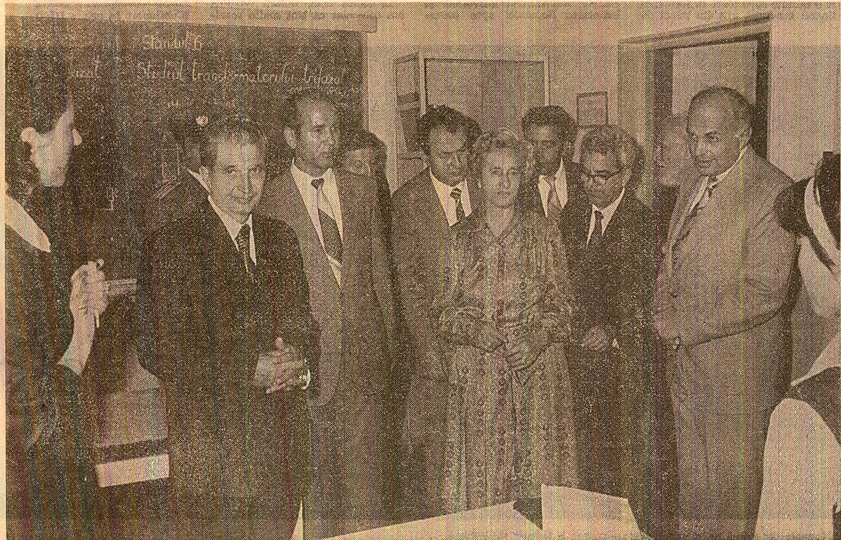
În mijlocul elevilor și cadrelor didactice de la Liceul Industrial nr. 2

lor. Totodată, a crescut producția de mașini electrice de diferite tipuri și puteri necesare programelor prioritare. În ultimii trei ani, acțiunea de tipizare s-a extins, cuprinzînd în momentul de față 55 la sută din întreaga producție. Secretarul general al partidului este informat, de asemenea, că produsele fabricate la Întreprinderea de mașini electrice sînt cunoscute astăzi în peste 50 de țări de pe toate continentele. Secția este dotată cu utilaje moderne de înaltă precizie și productivitate, multe dintre ele fiind rodul creației proprii. Pe parcurs sînt evidențiate, de asemenea, rezultatele obținute pînă în prezent în cadrul programului de integrare a învățămîntului cu cercetarea și producția întocmit împreună cu Facultatea de electrotehnică a Institutului politehnic București. Se subliniază că temele care vizează modernizarea motoarelor de curent continuu pentru metalurgie, asimilarea unor motoare asineroase solicitate la export, realizarea de aparatură pentru controlul calității produselor prezintă un real folos pentru întreprindere. De ase-