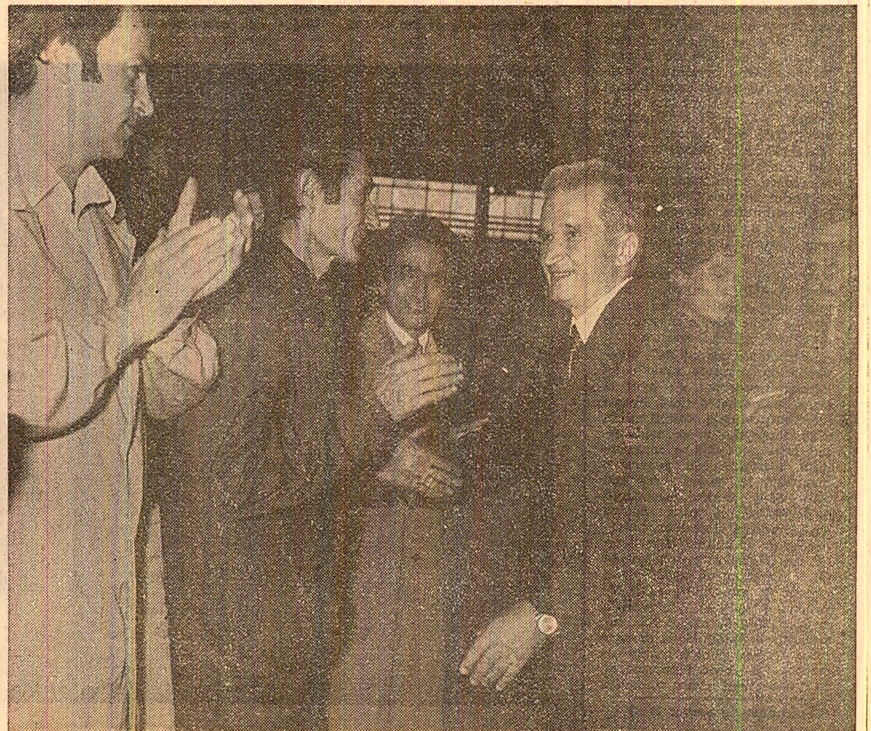
La Întreprinderea de mașini electrice, aplauze pentru conducătorul iubit