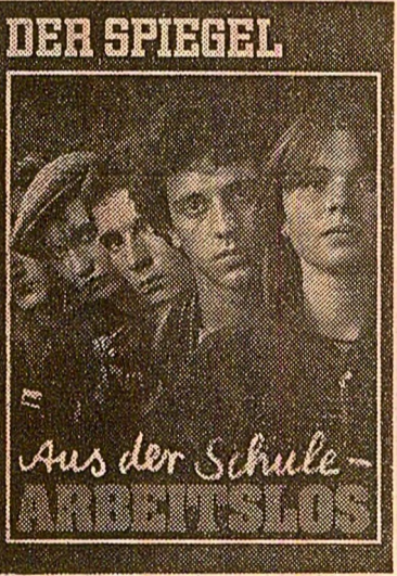
Coperta revistei „Der Spiegel” consacrată șomajului în rîndul tineretului, purtînd titlul: „Da pe băncile școlii direct pe listele de șomeri”

părinții care și-au pierdut slujbele. În aceste condiții, este aproape de necrezut să înțelegem că, în țările dezvoltate, care, adeseori, sînt considerate ca „etalon” de civilizație, se menține analfabetismul! În S.U.A., constată „Ford Foundation”, 25 milioane de oameni nu știu să scrie și să citească. După calculul realizat de Comisia C.E.E., în țările Pieței comune numărul neștiutorilor de carte este de 4-6 la sută din totalul populației. Pe țări — subliniem, nu e vorba de state africane, sau asiatiche, ci de țările Pieței comune din Europa — situația se prezintă astfel: în Olanda — 4 la sută; în Italia 5,2 la sută, adică aproximativ 2,5 milioane de oameni; în Anglia 2 milioane de oameni sînt înregistrați în categoria analfabților. Pe întreaga planetă, peste 25 milioane de copii și 600 milioane adulți sînt lipsiți de o instrucție elementară.