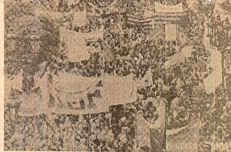
„Citeva sute de mii de membri ai sindicatelor au demonstrat în Germania occidentală în semn de protest împotriva programului nouului guvern de a reduce cheltuielile sociale” — scrie ziarul „International Herald Tribune”, care publică fotografia de mai sus, ce înfățișează un aspect de la manifestația desfășurată la Frankfurt. Asemenea demonstrații — scrie ziarul — au mai avut loc la Dortmund, în bazinul Ruhrului, cu participarea a 100 000 persoane, precum și la Nürnberg, unde au fost alți 70 000 de manifestații

LONDRA 9 (Agerpres). — Într-o cuvîntare rostită în Camera Comunelor, ministrul britanic de finanțe, Geoffrey Howe, a prezentat o analiză a situației economice a țării,