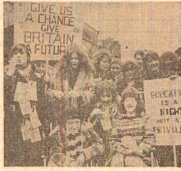
O demonstrație a tineretului la Londra sub deviza: „Acordați-ne o șansă! Acordați țării un viitor! Educația este un drept, nu un privilegiu!”

șansa de a se integra într-o activitate utilă. Este ceea ce presa vest-germană califică, cu o expresie zguduitoare, „generația fără viitor”. Fenomenul este cunoscut și răspîndit în egală măsură și în Franța, Anglia, Olanda, Belgia, în ansamblul țărilor occidentale, constituînd o flagrantă incriminare a rînduțiilor capitaliste, care-l generează. Cum scrie săptămînalul britanic „LABOUR WEEKLY”: „Cea mai gravă condamnare pentru o societate este să nu poată folosi energia și aspirațiile tinerilor ei”.