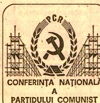
CONFERINȚA NAȚIONALĂ A PARTIDULUI COMUNIST ROMÂN

Conferințele naționale — au fundamentat și clarificat și sînt de profundă originalitate pentru infaptuirea politicii de reparare rațională a forțelor de producție. Reorganizarea administrativ-teritorială a țării, din anul 1968, a impulsionat întărirea rolului unităților teritoriale de bază — orașul și comuna — a determinat eliminarea unor veritabile intermedii și creșterea unui cadru favorabil pentru renașterea rațională a forțelor de producție, ceea ce a dus la ridicarea mai rapidă a unor județe și localități rămase în urmă.