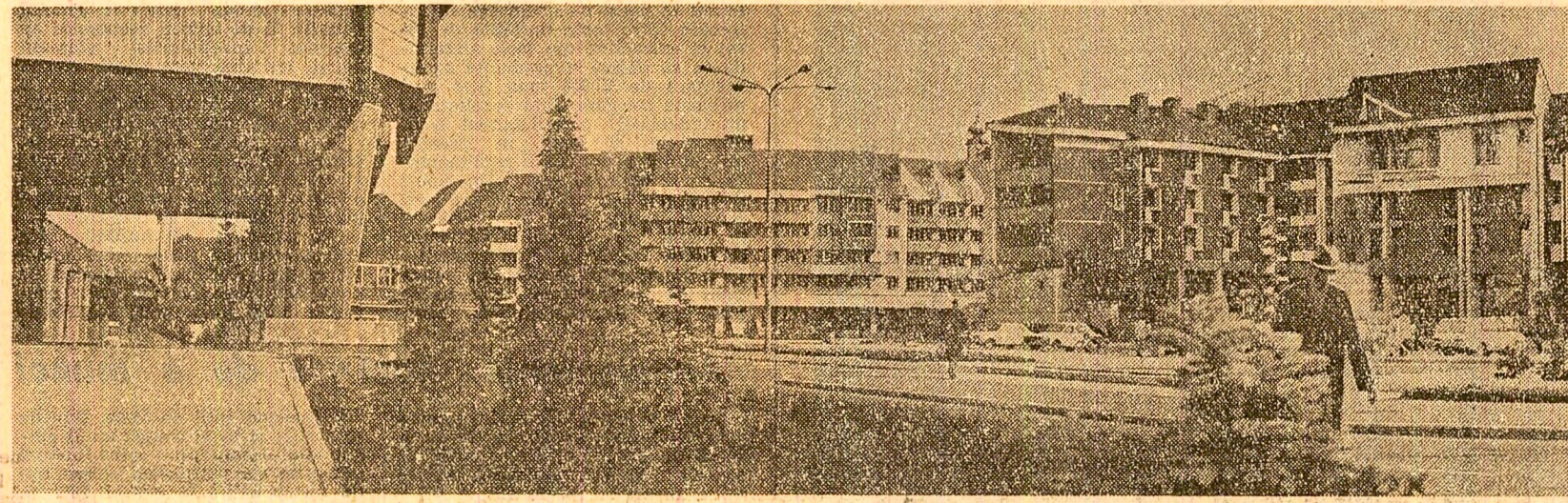
Noul centru civic al municipiului Bistrita: o arhitectură modernă, care îmbină firesc frumosul cu specificul local