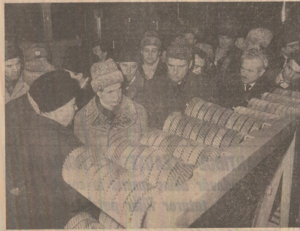
La marea cetădelă a constructorilor de maşini: întreprinderea de autocomoane

În această atmosferă însufleţitoare, elocventă prezidenţială decolată din municipiul Braşov, îndreptîndu-se spre Predeal.