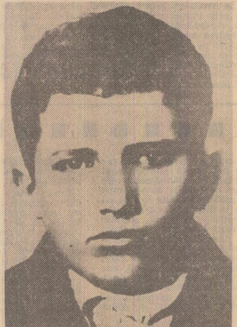
Fotografie a tovarășului Nicolae Ceaușescu din 1933, anul intrării sale în U.T.C.