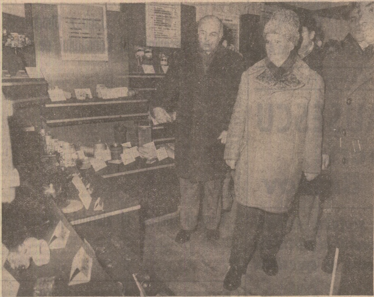
În timpul vizitei la întreprinderea mecanică nr. 2

În cadrul analizei s-a subliniat că, pe lângă realizarea în bune condiţii a producţiei de bază — autovehiculele — colectivul are în vedere extinderea fabricaţiei de maşini-unelte şi agregate pentru necesităţile proprii, cit şi pentru alte unităţi industriale. S-a arătat că numai pentru