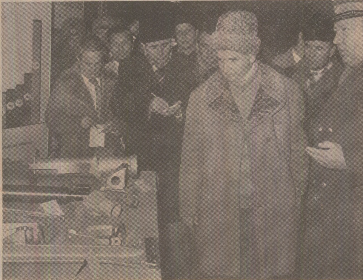
La întreprinderea de construcții aeronautice