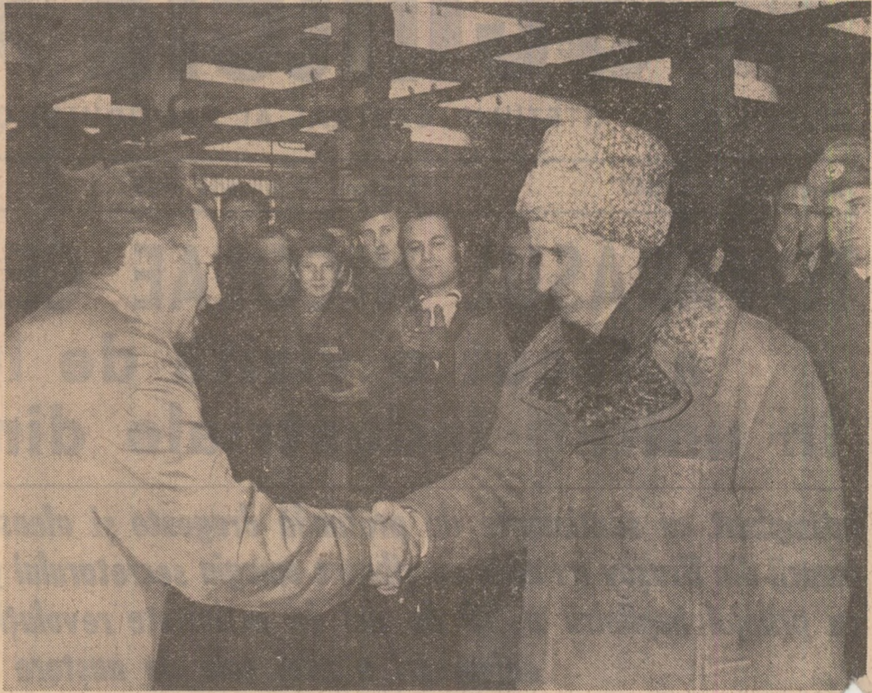
În timpul vizitei, tovarăşul Nicolae Ceauşescu este informat că, în conformitate cu programul general de dezvoltare a întreprinderii „Hidromecanică", pînă în anul 1987, producţia de transmisii hidromecanice va creşte cu circa 50—60 la sută, iar la unitatea nr. 1 a întreprinderii se vor realiza anual circa 40.000 de turbosuflete pentru supraalimentarea motoarelor diesel, faţă de 25.000 cit se fabrică în prezent. Se informează, de asemenea, despre asimilarea unor componente pentru produse care pînă acum se aduceau din import.

La sosirea în întreprindere, tovarăşul Nicolae Ceauşescu a fost întâmpinat de Alexandru Mărgăritescu, directorul general al Centralei de utilaj tehnologic şi material rulant, şi de membrii conducerii întreprinderii. Mîndri de realizările lor, muncitorii, inginerii, tehnicienii