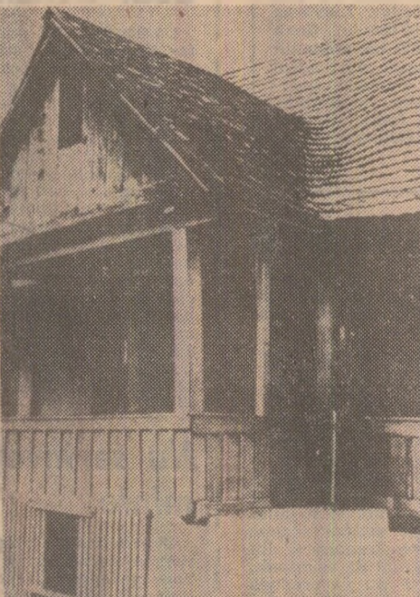
Casa din comuna Scornicești — Olt în care s-a născut tovarășul Nicolae Ceaușescu

Cu prilejul împlinirii a 50 de ani de activitate revoluționară a tovarășului Nicolae Ceaușescu și aniversării zilei sale de naștere, conștienți că toate marile progrese realizate în perioada de după Congresul al IX-lea sint legate indisolubil de prodigioasa activitate a celui mai iubit fiu al poporului nostru, de contribuția sa decisivă la elaborarea și aplicarea politicii științifice a partidului, de spiritul inovator promovat în toate sferele vieții sociale, îl adresăm din adîncul inimii cele mai calde urări de sănătate, de putere de muncă, de viață îndelungată, spre binele și fericirea națiunii noastre, spre gloria României socialiste.