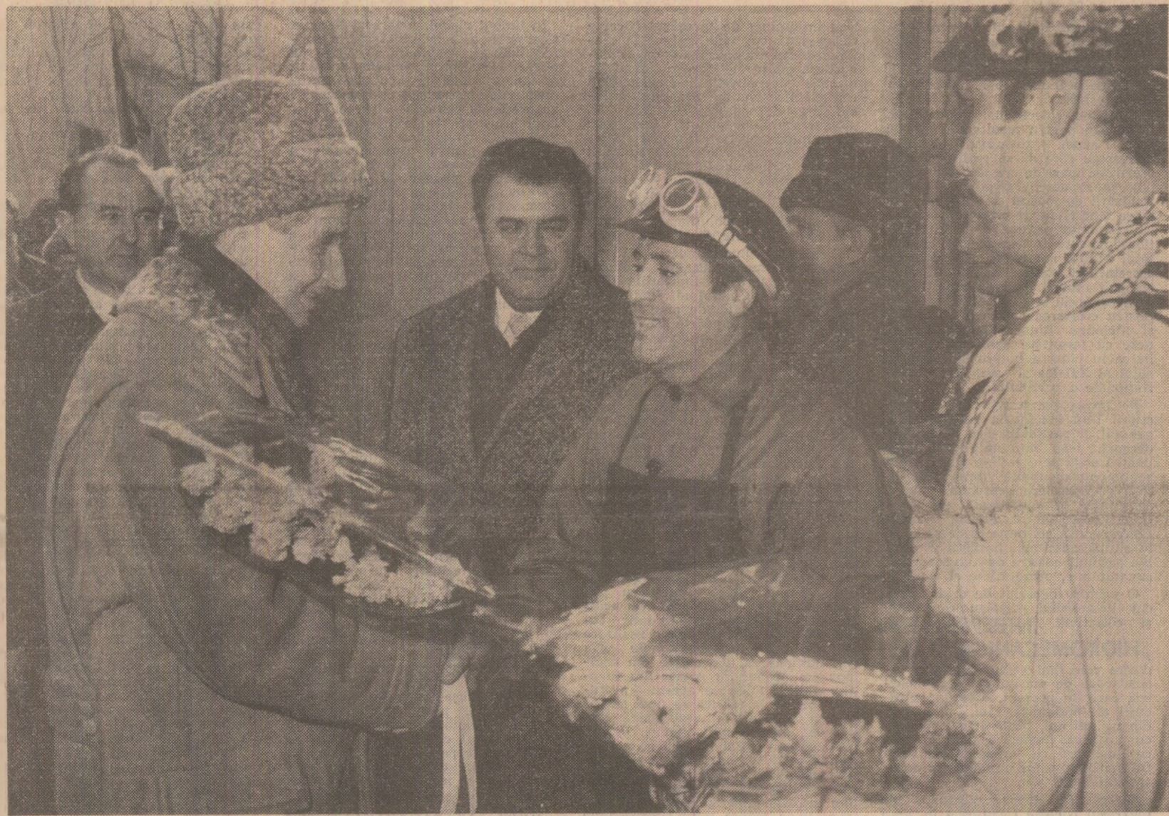
Din toată inima, florii conducătorului lubit

Întîmpinat cu sentimente de profundă dragoste și aleasă prețuire, oamenii muncii din Brașov au adus un vibrant omagiu secretarului general al partidului cu prilejul împlinirii a 50 de ani de activitate revoluționară și apropiatei aniversări a zilei sale de naștere