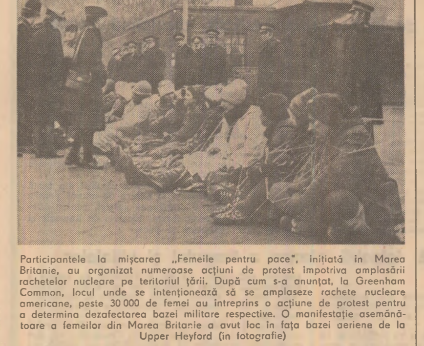
Participantele la mișcarea „Femeile pentru pace“, inițiată în Marea Britanie, au organizat numeroase acțiuni de protest împotriva amplasării rachetelor nucleare pe teritoriul țării. După cum s-a anunțat, la Greenham Common, locul unde se intenționează să se amplaseze rachete nucleare americane, peste 30.000 de femei au întreprins o acțiune de protest pentru a determina dezafectarea bazei militare respective. O manifestație asemănătoare a femeilor din Marea Britanie a avut loc în fața bazei aeriene de la Upper Heyford (în fotografie)

Acțiunile de protest împotriva amplasării de rachete nucleare în Europa MAREA BRITANIE