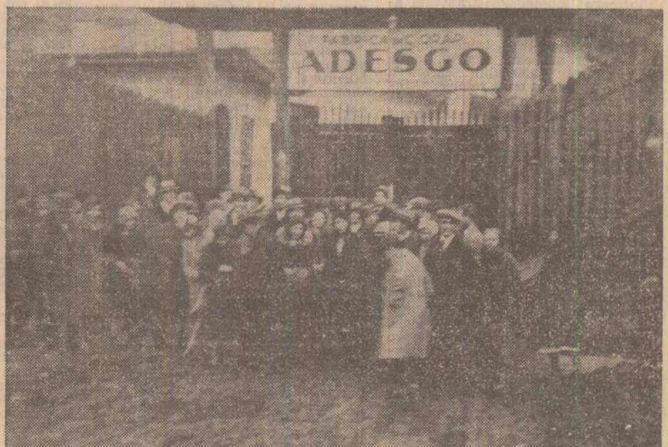
Aspect din timpul grevei de la Fabrica „Adesgo” din București — 1933