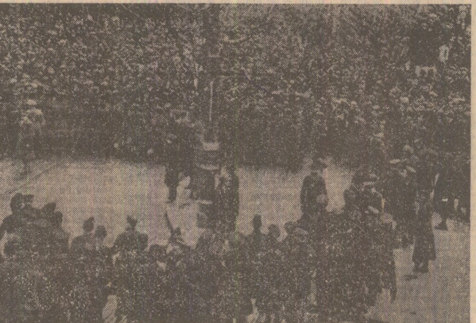
Reprimarea unei demonstrații muncitorești în București — 1932