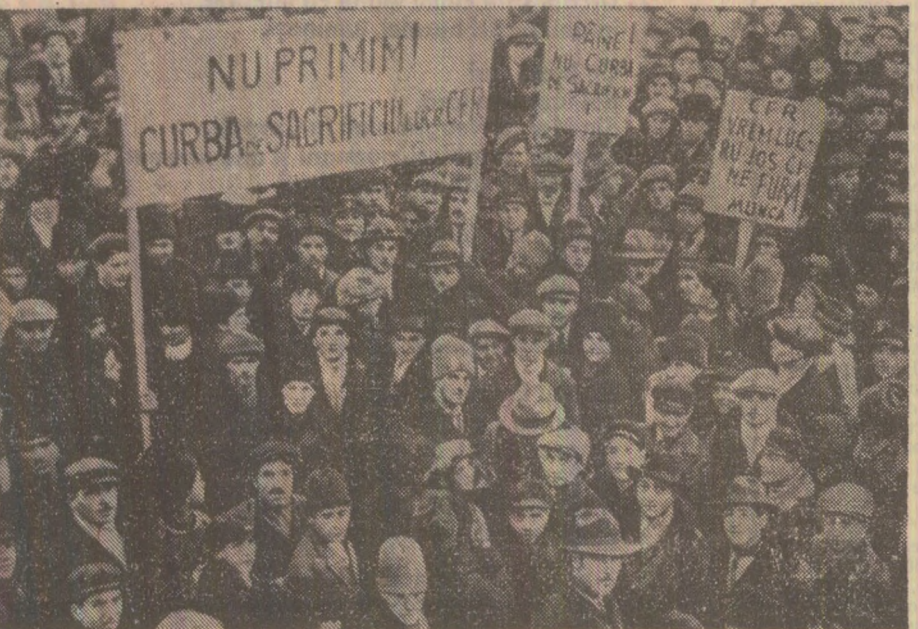
Demonstrația muncitorilor din București — 29 ianuarie 1931

Pagină realizată de: Conf. univ. dr. Mircea MUȘAT Conf. univ. dr. Ion ARDELEANU