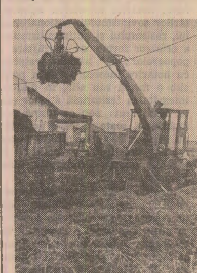
Fertilizarea terenurilor — acțiune de mare importanță, la care trebuie mobilizate acum toate forțele.

În mod firesc, realizarea programului porumbului în cultură intensivă