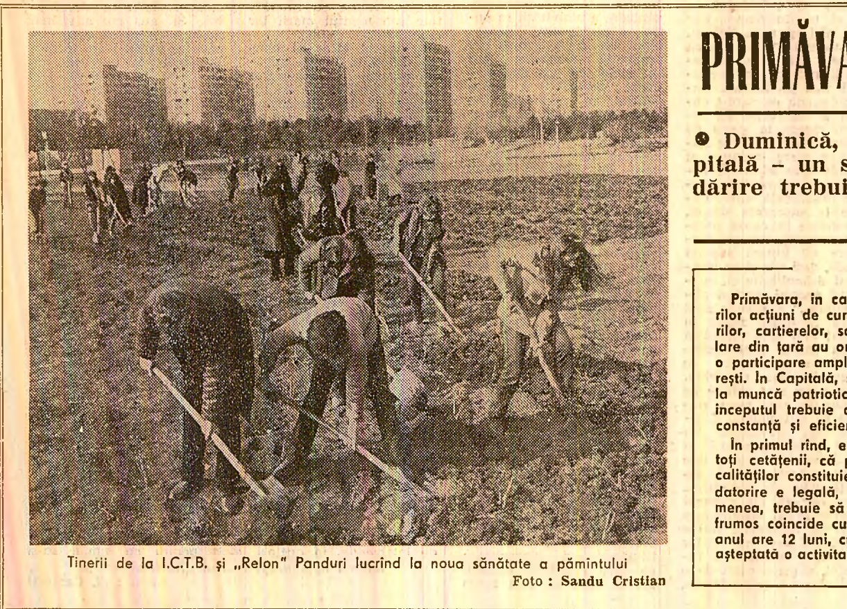
Tinerii de la I.C.T.B. și „Relon” Panduri lucrînd la noua sănătate a pămîntului