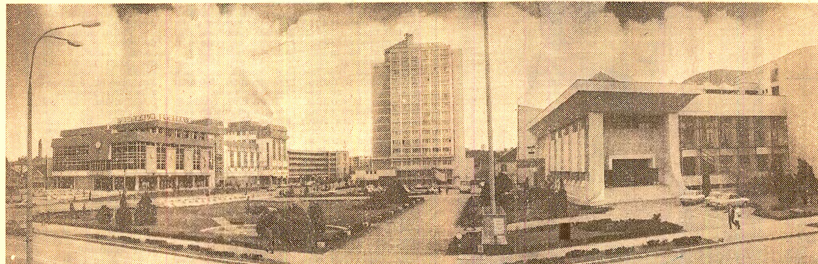
Sibiu. Frumoasă așezare urbanistică a patriei a cunoscut în ultimii ani o continuă dezvoltare. Centrul civic al orașului atrage prin arhitectura sa originală, modernă.