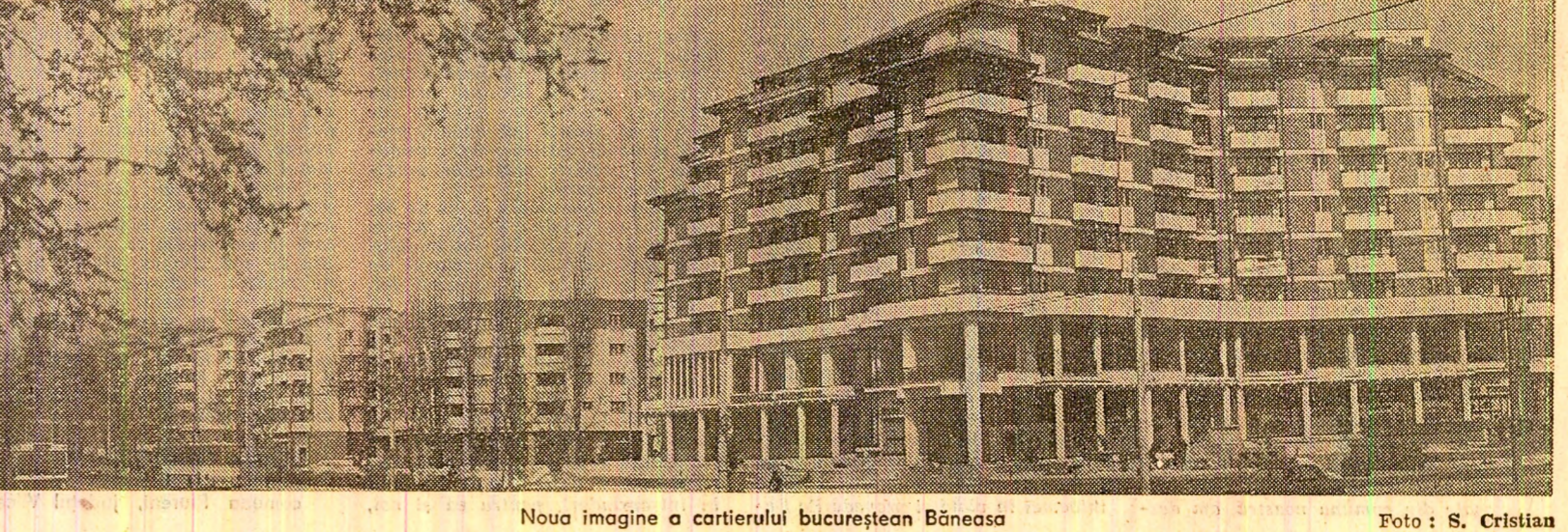
Noua imagine a cartierului bucureștan Băneasa