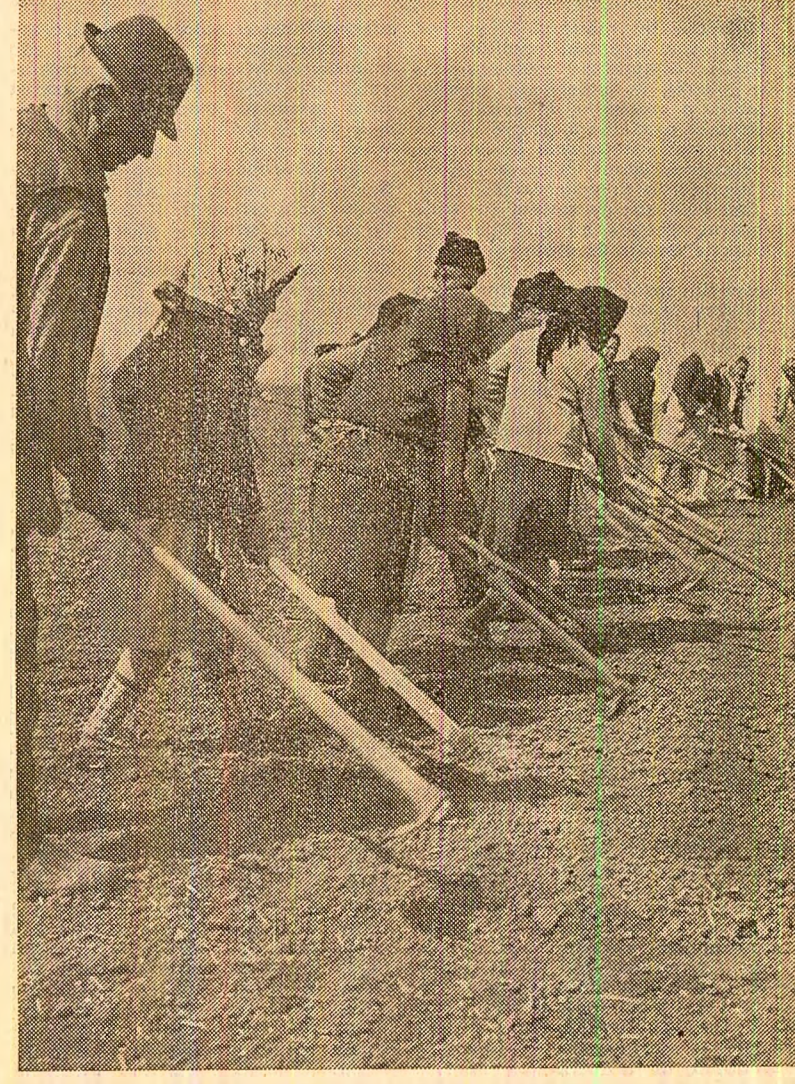
Membrii cooperativei agricole din Pîscu-Vechi, județul Dolj, au început lucrările de întreținere a culturilor.

— În ansamblul de măsuri pentru îmbunătățirea în continuare a mecanismului economico-financiar și valutar în activitatea de comerț exterior, un rol important revine perfecționării formei de retribuire a personalului muncitor din întreprinderile de comerț exterior, prin aplicarea fermă a principiului socialist de repartizare, în raport cu munca depusă și rezultatele obținute. Potrivit prevederilor proiectului de program, personalul muncitor din întreprinderile de comerț exterior și cel din compartimentele autorizate, conform legii, să efectueze operațiuni de comerț exterior, inclusiv exportul pe bază de cote, în lei, aplicate la 1000 ruble sau 1000 dolari pentru export, import, aport valutar realizat și pentru celelalte operațiuni cuprinse în volumul de activitate al fiecărei întreprinderi sau compartiment de comerț exterior. Aceste cote, ca formă specifică de retribuire, urmează a se stabili anual sau trimestrial — în funcție de volumul de activitate al întreprinderilor sau compartimentelor de comerț exterior, separat pentru export și separat pentru import. De asemenea, în vederea stimulării realizării pla-