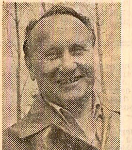
LA I.A.S. PREJMER, DISTINSĂ RECENT CU CEL DE-AL DOILEA TITLU DE „EROU AL MUNCII SOCIALISTE”

ducții mari fără o fertilizare corespunzătoare a terenurilor cu îngrășăminte naturale și chimice, fără aplicarea tratamentelor necesare, fără întreținerea timp a culturii. Voi demonstra cu un exemplu critic. Unul din șefii noștri de fermă a neglijat cultura cartofului tocmai în perioada efectuării lucrărilor de întreținere. Dacă și această fermă ar fi realizat recolta la nivelul celorlalte două, întreprinderea ar fi realizat 40.000 kg cartofi la hectar. Bineînțeles, abaterile nu sînt trecute cu vederea.