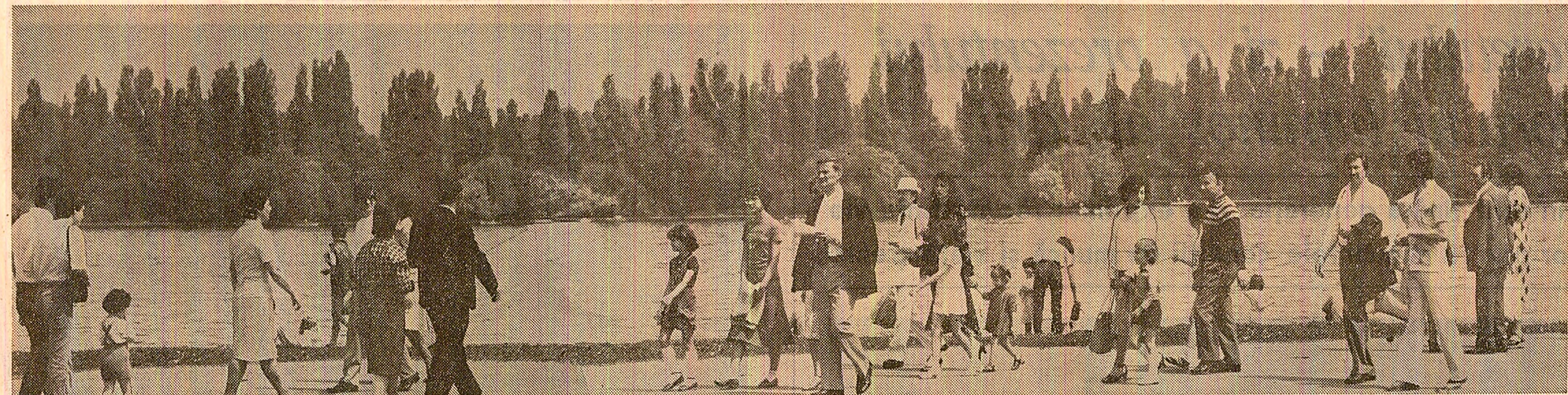
În Parcul Herăstrău, unul din numeroasele și atractivele locuri de agrement ale Capitalei

La Borsă, Baia Sprie și Tirgu Lăpuș au avut loc spectacole omagiale însoțite de programe de dis-