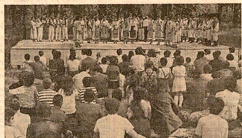
Tinerii, de ziua lor, prezentați în zonele de agrement (sus — București) și la numeroasele spectacole în aer liber (în fotografia de jos — trimisă de E. Robitsek, din Timișoara)