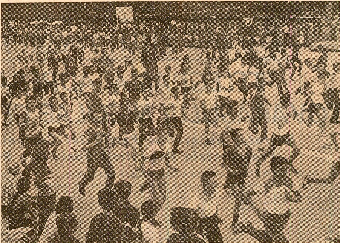
O parte din participanții la faza pe Capitală a „Crosului tineretului”

Bucuria tinerilor buzoieni de a avea minunate condiții de muncă și viață create de societate s-a regăsit din plin cu prilejul manifestărilor prilejuate de Ziua de 2 mai. Dimineața, pe arterele principale ale municipiului Buzău s-a desfășurat concursul de marșuri patriotice „Trec detașamentele cîntînd”, iar între orele 10-13,30 stadionul „Gloria” a fost gazda unui mare și frumos spectacol muzical-coregrafic purtînd genericul „Sărbătoarea tineretului, sub semnul dragostei față de patrie și partid”, susținut de peste 2.300 de elevi, pionieri, șoimi ai patriei și sportivi de la A.S.A. Buzău și cluburile școlare din oraș în fața a peste 15.000 de spectatori. În continuare, între orele 14-23 a avut loc, în cochetul parc al tineretului, o suită de spectacole culturale-artistice susținute de formații de tineri artiști amatori laureați ai Festivalului național „Cîntarea României”. (Stelian Chiper, corespondentul „Scintei”).