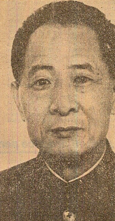
dintre Partidul Comunist Român și Partidul Comunist Chinez, dintre Republica Socialistă România și Republica Populară Chineză — întemeiate pe bogate tradiții în lupta pentru realizarea aspirațiilor comune ale popoarelor noastre de libertate și progres social — cunoscut o dezvoltare continuă, avînd ca bază trainică principiile depline egalității în drepturi, respectării independenței și suveranității naționale, neamsteșcutului în treburile interne și avantajului reciproc, principiile de o importanță decisivă pentru întărirea prieteniei, a colaborării și cooperării pe cele mai diferite planuri. Un rol important în întărirea acestor raporturi

— rod al unor îndelungate eforturi depuse cu perseverență de ambele părți de-a lungul celor 15 ani care l-au purtat pe tovarășul Nicolae Ceaușescu, secretar general al C.C. al P.C. Chinez, Zhao Ziyang, primul Consilier de Stat al R.P. Chineze, Deng Xiaoping, membru al Comitetului Permanent al Biroului Politic al C.C. al P.C. Chinez, președintele Comisiei centrale consultative a P.C. Chineze, cu alți veterani revoluționari au constituit un nou și remarcabil moment în bogata cronică a legăturilor romano-chineze, avînd un rol determinant în aprofundarea neîntreruptă a bunelor raporturi dintre țările noastre. Aceste schimburi de păreri au pus premant în evidență dorința comună de a asigura toate condițiile pentru ca relațiile romano-chineze să cunoască, în continuare, o puternică înflorire, pe măsura posibilităților sporite pe care le creează dezvoltarea economico-socială a celor două țări socialiste. Hotărîrea de a amplifica și mai mult conlucrarea prietenească în toate domeniile și-a găsit expresie în înțelegerile convenite, în documentele semnate în cursul vizitei.