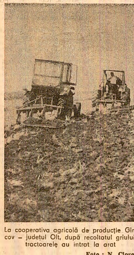
La cooperativa agricolă de producție Gircov — județul Olt, după recoltatul grului, tractoarele au intrat la orat