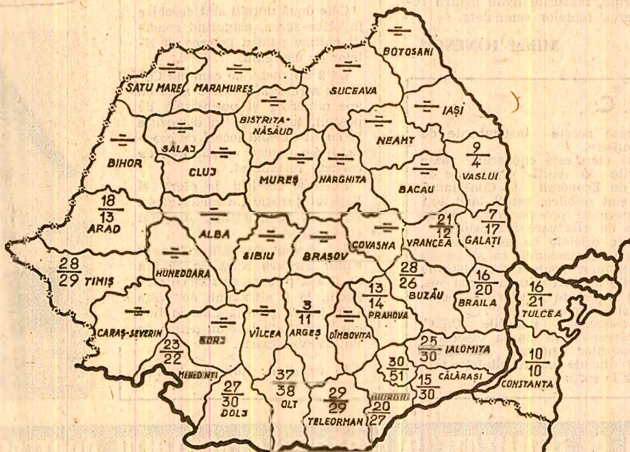
STADIUL RECOLTĂRII GRULUI, în seara zilei de 27 iunie. Cifrele înscrise pe hartă reprezintă, în procente, suprafețele de pe care a fost strins grul în întreprinderile agricole de stat (sus) și în cooperativele agricole (jos) în județele notate cu o linie nu începuse secerișul grului la data respectivă.

In aceste zile, sarcina cea mai importantă ce revine oamenilor muncii din agricultură este de a încheia în cel mai scurt timp recoltarea orzului și de a intensifica la maximum secerișul grului. Cu atât mai mult este necesar să se lucreze în ritm intens la strângerea recoltei de cereale păioase, cu cit temperaturile ridicate din ultimele zile au favorizat coacerea lanurilor pe mari suprafețe. Acum, orice întârziere la seceriș este de natură să provoace pierderi de recoltă prin scuturarea spicilor!