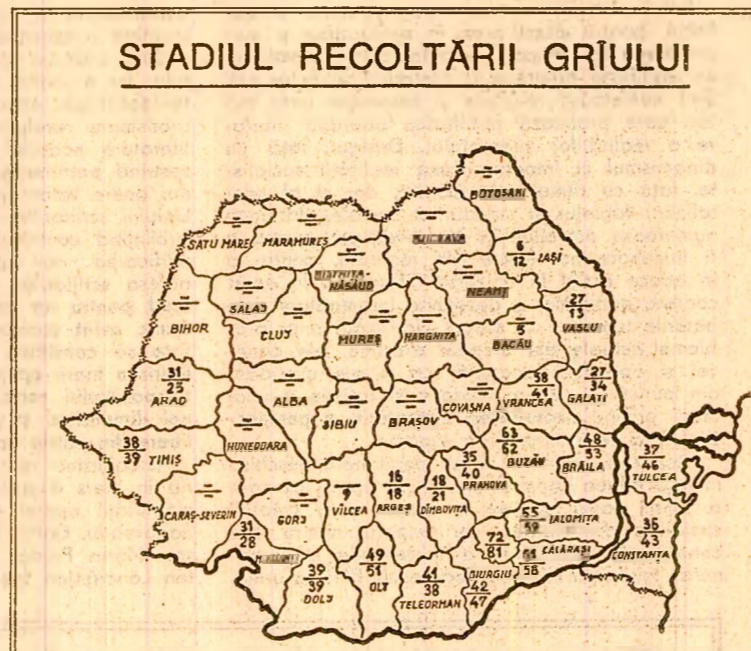
STADIUL RECOLTĂRII GRIULUI. Stadiul recoltării grâului în seara zilei de 1 iulie. Cifrele înscrise pe hartă reprezintă, în procente, suprafețele de pe care a fost strins grâul...