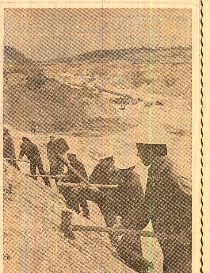
Brigadieri pe șantierul Canalului Dunăre — Marea Neagră