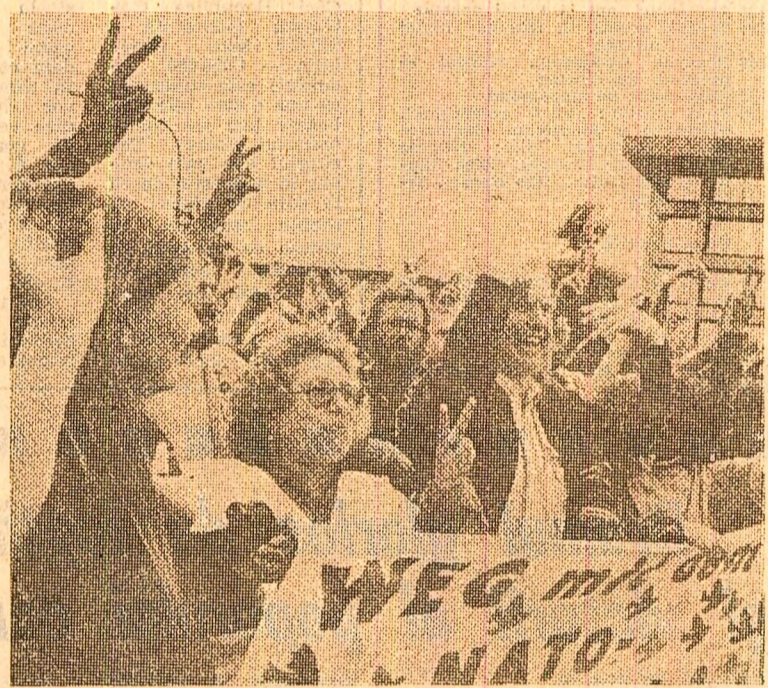
Partizanii ai păcii din diverse țări ale Europei occidentale au participat recent la un amplu marș desfășurat pe străzile orașului Bruxelles...