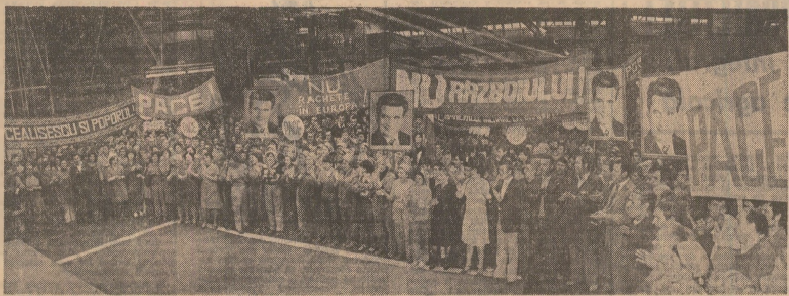
Ieri, la adunarea oamenilor muncii de la întreprinderea „Autobuzul” din Capitală

O cerință ferm exprimată în cadrul adunărilor și mitingurilor oamenilor muncii