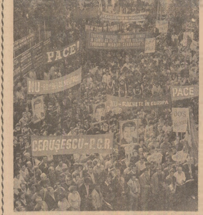
Relatări de la adunări și mitinguri ale oamenilor muncii - în pagina a II-a