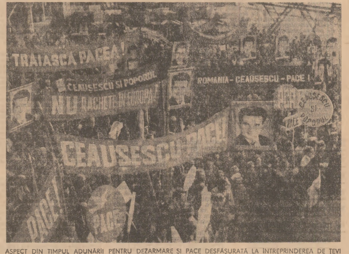
ASPECT DIN TIMPUL ADUNĂRII PENTRU DEZARMARE ȘI PACE DESFĂȘURATĂ LA ÎNȚEPAREA DE TEVI „REPUBLICA” DIN CAPITALĂ