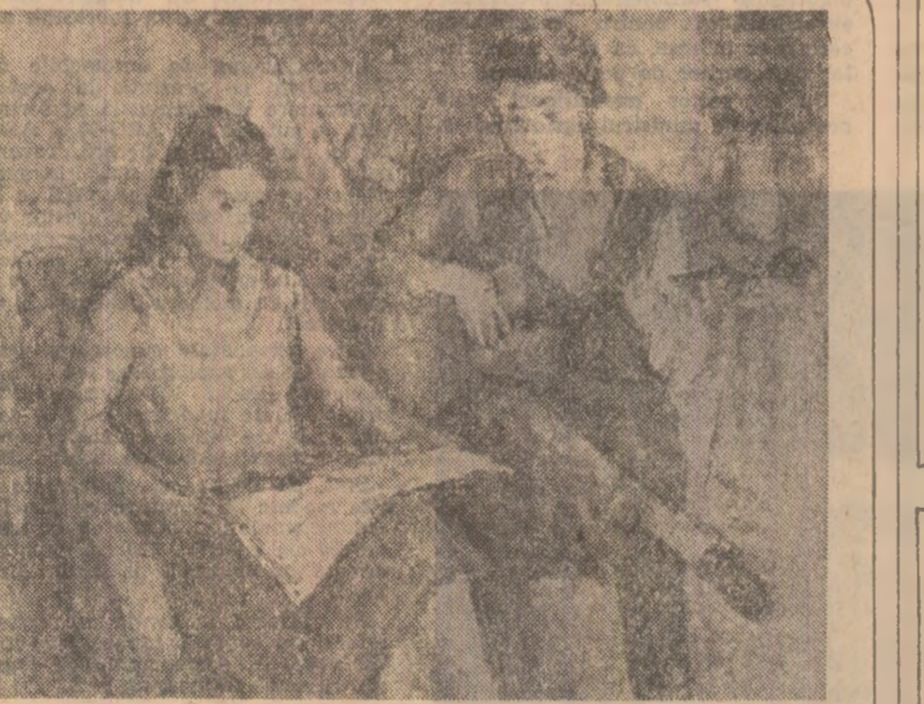
La câmpul cultural