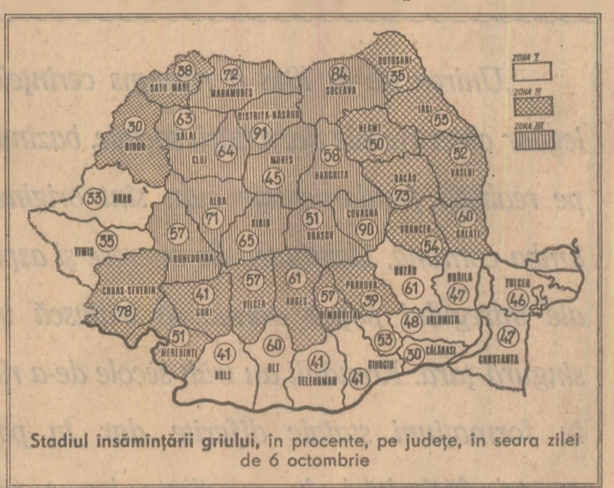
Stadiul însămînțării griului, în procente, pe județe, în seara zilei de 6 octombrie

• Pentru realizarea și depășirea vitezei zilnice stabilite este necesar ca noaptea să se lucreze la pregătirea terenului, iar întreaga zi-lumină la însămînțări