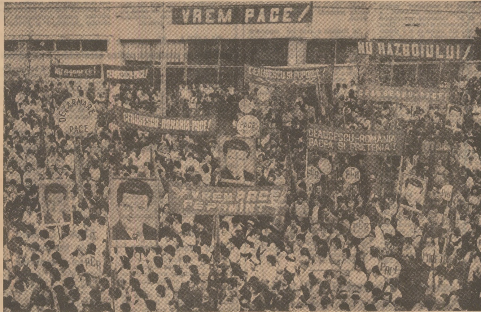
Imagine de la adunarea oamenilor muncii de la Intreprinderea „Optica română” din București.