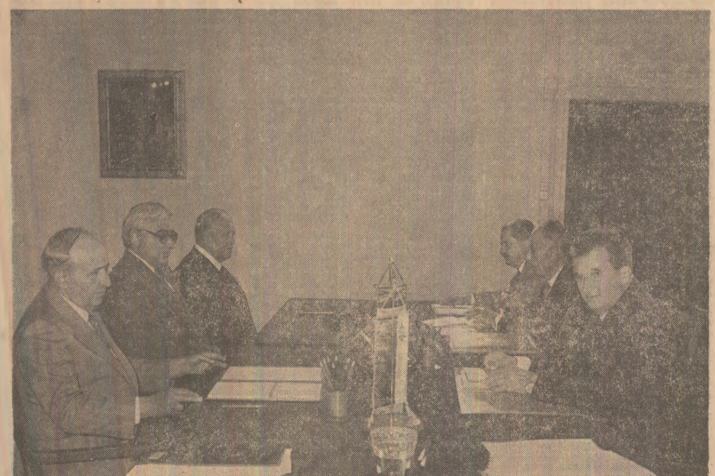
În timpul convorbirilor oficiale