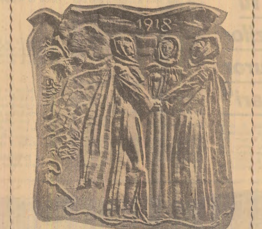
Momente ale epopeii naționale (detaliu) Relief, ghips de Gh. ADOC