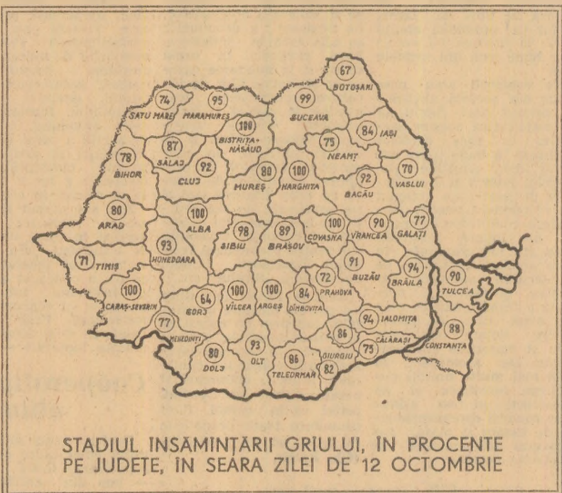
STADIUL ÎNSĂMÎNȚĂRII GRÂULUI, ÎN PROCENTE PE JUDEȚE, ÎN SEARA ZILEI DE 12 OCTOMBRIE

urilor preconizate și prin munca plină de dăruire a mecanizatorilor, în trei-patru zile lucrările vor fi încheiate pe toate suprafețele. Acționăm cu forțe sporite. Îndesobi în cadrul agroindustriale Suceveni, Nicorești, Pechea, Tudor Vladimirescu, unde au rămas de semănat suprafețe mai mari. Ne preocupăm, tîrînd seama de creșterea răspunderii mecanizatorilor și specialiștilor din agricultura județului nostru pentru realizarea unor lucrări de cea mai bună calitate, care să asigure pentru a doua oară un recolt bun în anul viitor.