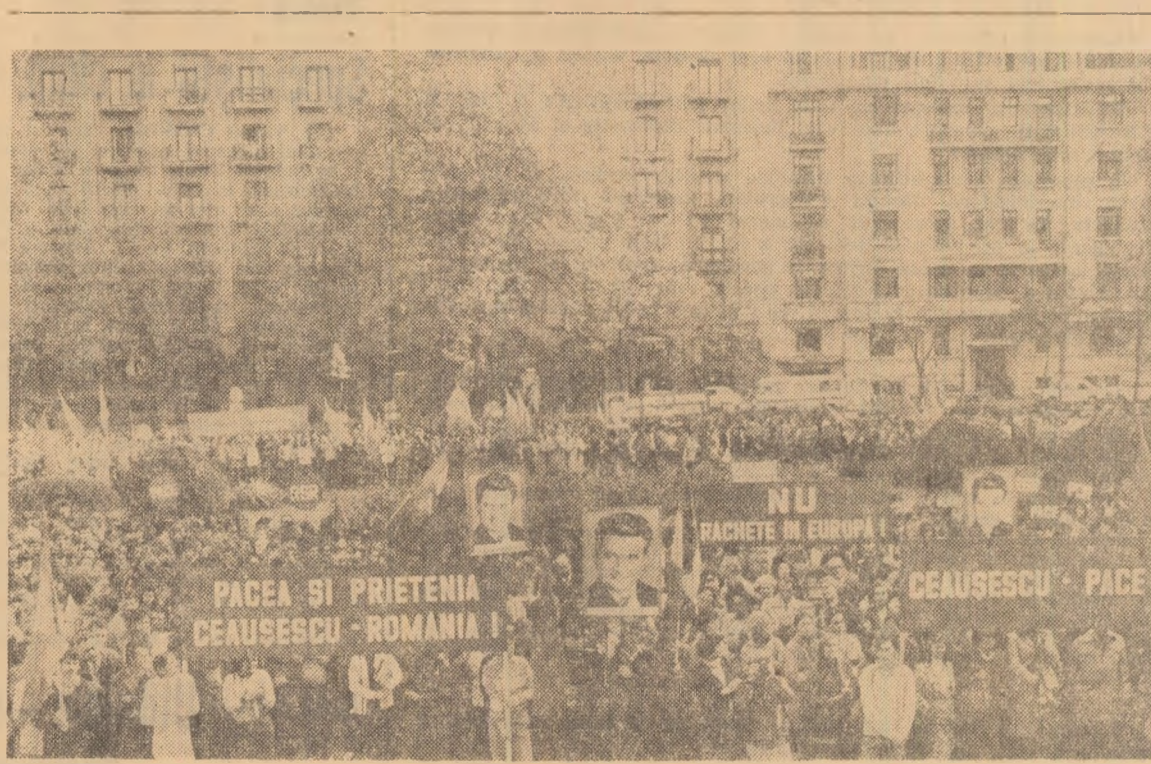
Glasul hotărît al studenților și cadrelor didactice de la Universitatea din București, în sprijinul dezarmării și păcii