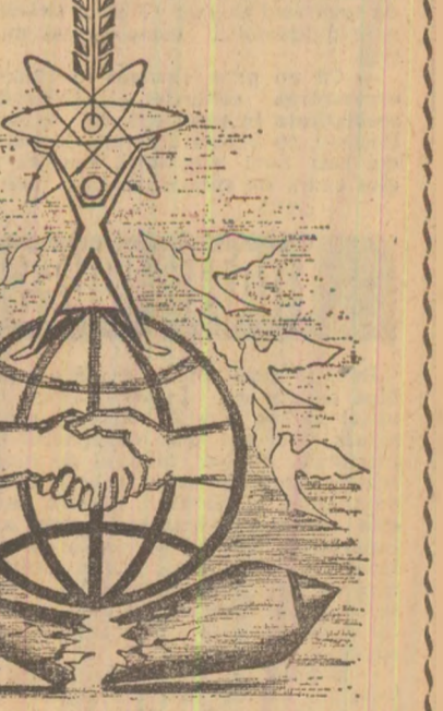
Desen de TUDOR ÎSPAS

Arhitectul morbid al războiului „inevitabil” nu se sfîșie să facă o voluptuoasă reclamă noilor arme de distrugere în masă. Fotografiindu-le, eclatant, în clipa în care țese țelere din hangare ori în momentul dezaoregării treptelor de propulsie a focosului nimicitor. Dacă