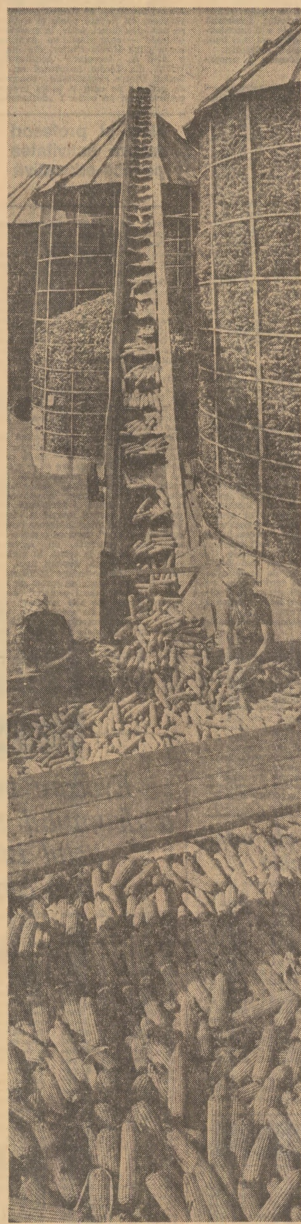
La baza de recepție Frâsinet, județul Olt, se transportă în patele ultimele cantități de porumb.