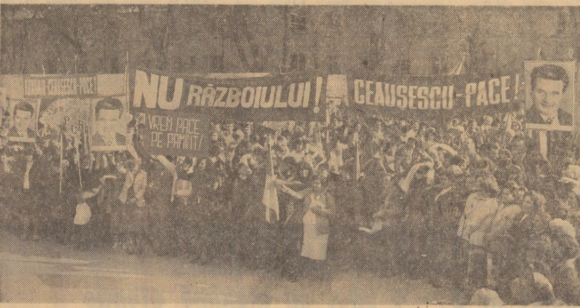
Ieri, la mitingul oamenilor muncii de la Filatura românească de bumbac din Capitală.