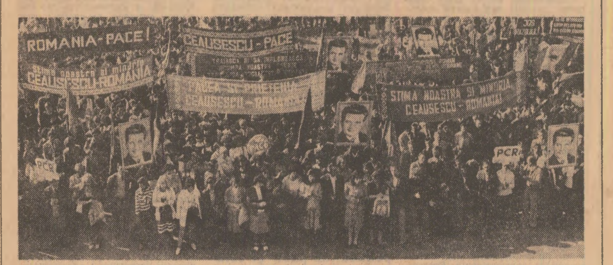
ieri, la adunarea de la Institutul de fizică și ingineria nucleară de pe platforma Măgurele