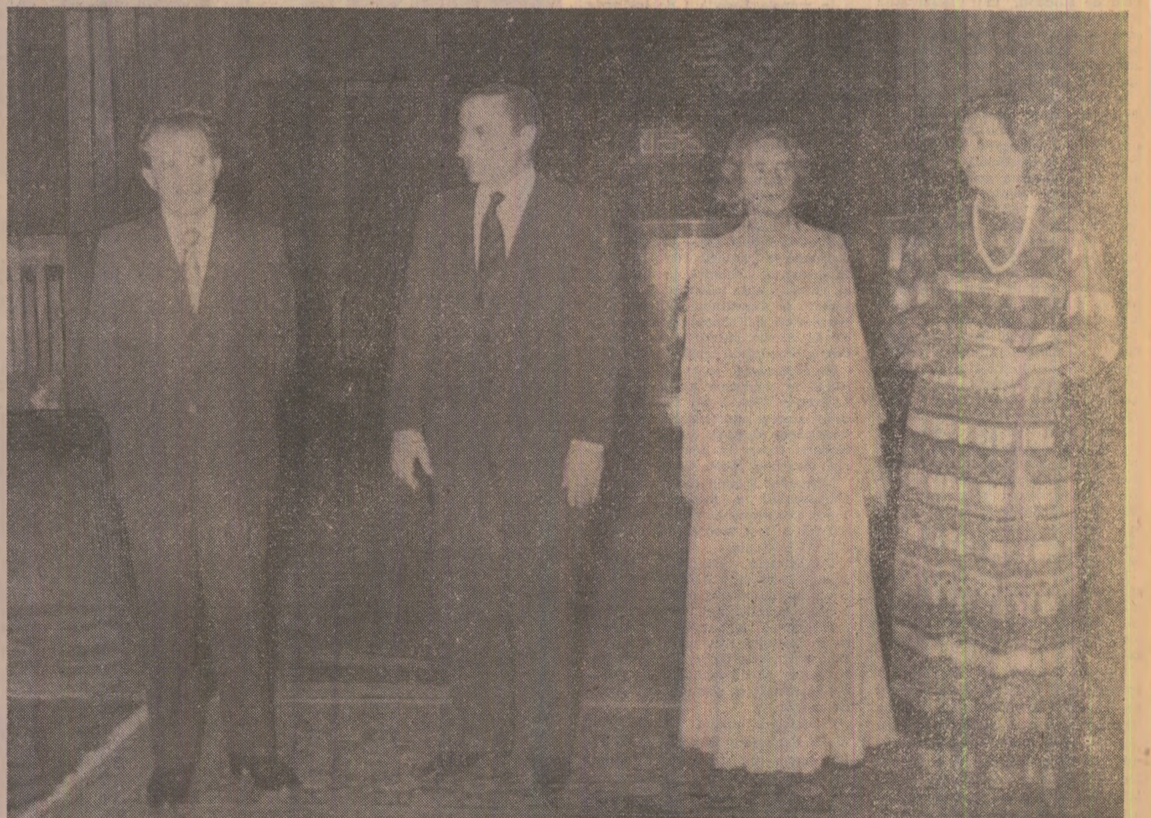
Înainte de dîneul oficial