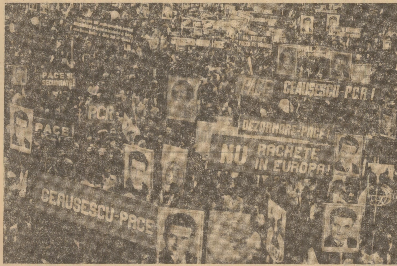
În timpul adunării oamenilor muncii din municipiul Satu Mare