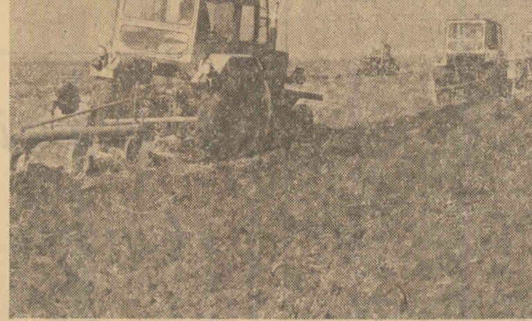
Se execută arături adinci de toamnă pe ogoarele C.A.P. Brănești, sectorul agricol Ilfov