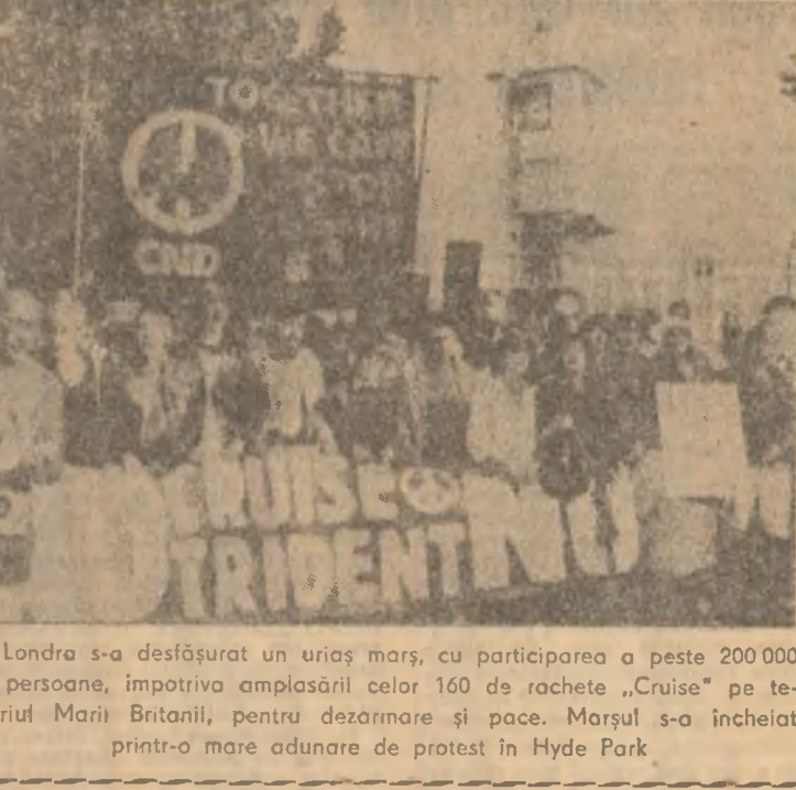
La Londra s-a desfășurat un urias mars, cu participarea a peste 200.000 de persoane, împotriva amplasării celor 160 de rachete „Cruise” pe teritoriul Marii Britanii, pentru dezarmare și pace. Marșul s-a încheiat printr-o mare adunare de protest în Hyde Park.

verifica o dată punctele de vedere ale partenerilor în această chestiune. Agenția Reuter comentează că, prin acest punct, moțiunea merge mai departe decât cea adoptată în luna mai de Folketing și care se pronunță împotriva instalării de noi rachete în Est și în Vest.