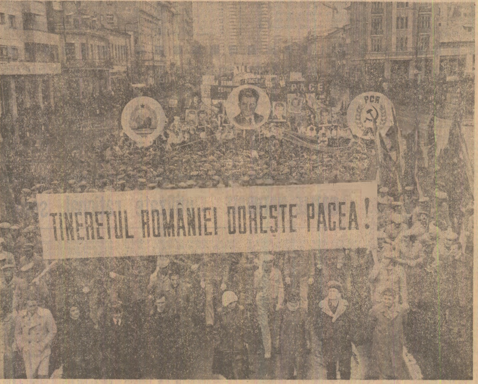
București, 12 noiembrie 1983. Marele marș al tineretului și copiilor pentru pace și dezarmare (Relatări în pagina a III-a)

Dionisie SINCAN (Continuare în pag. a V-a) Pavel PEREȘ