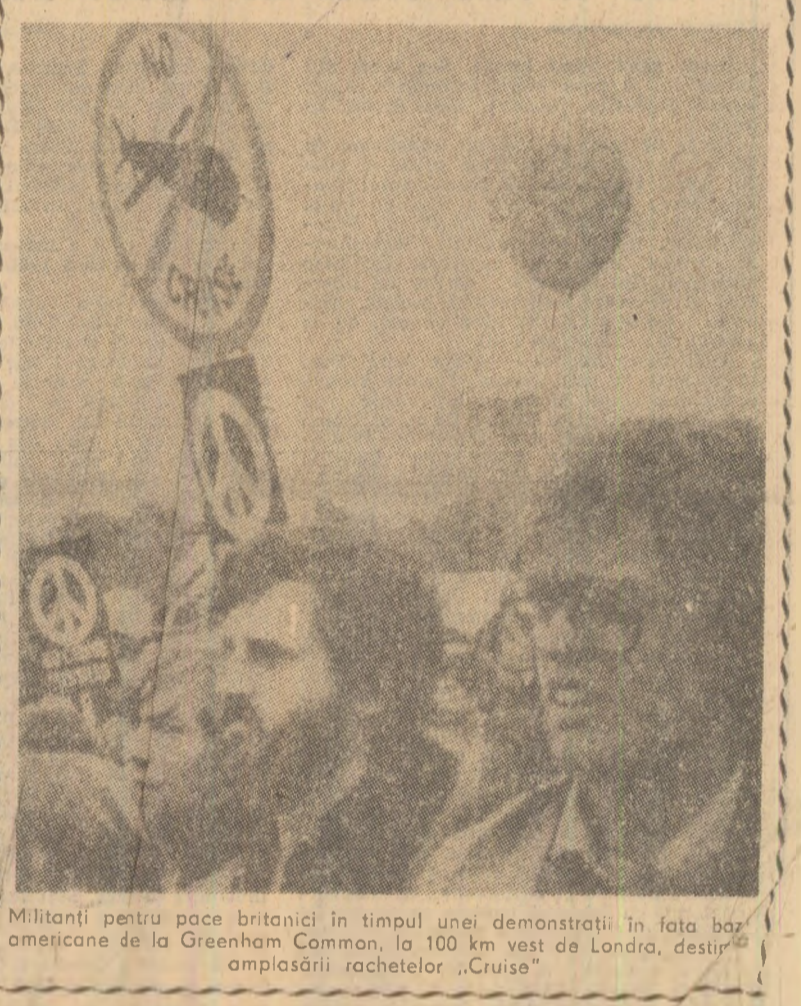
Militanţi pentru pace britanici în timpul unei demonstraţii în faţa birourilor...