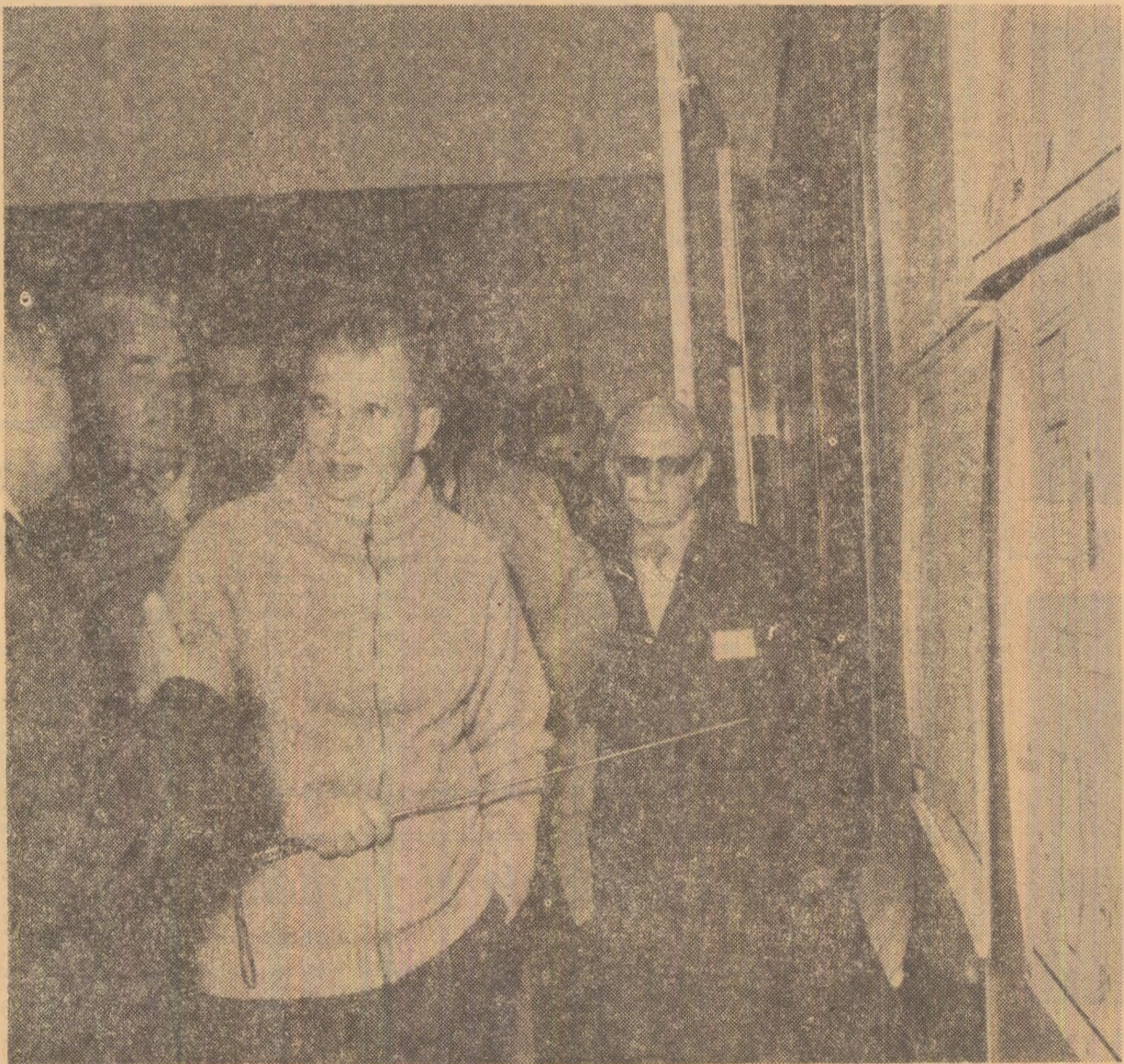
La centrala electrică de termoficare de la Ișalnița

Vizita de lucru a conducătorului partidului și statului în județul Dolj și Gorj a pus în lumină, prin întreaga sa desfășurare, prin concluziile și indicațiile formulate, preocuparea permanentă a conducătorului partidului și statului, a tovarășului Nicolae Ceaușescu personal pentru continua prosperitate economică-socială a țării, în acest cadru un loc important revenind obiectivelor stabilite privind dezvoltarea energicii. Dialogul de lucru din această zi a evidențiat, ca de fiecare dată, dragostea și prețuirea locuitorilor din această parte a țării, care, înțelegându-se cu secretarul general al partidului, și-au exprimat, asemenea tuturor cetățenilor României socialiste, hotărârea lor de a înfăptui politica partidului și statului, de a contribui cu întreaga lor forță creatoare la îndeplinirea programului de față și a societății socialiste multilaterale dezvoltate în patria noastră.