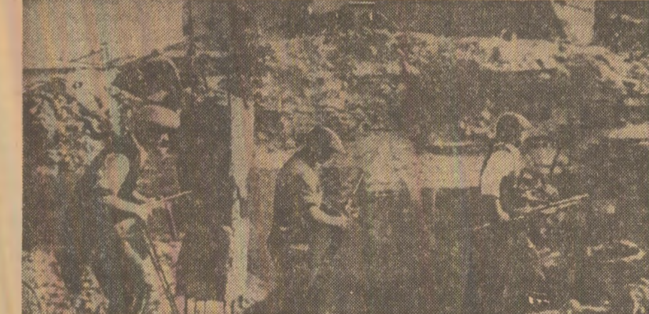
23 August 1944: formațiuni de luptă patriotice, organizate și conduse de partid, în acțiune împotriva trupelor hitleriste din Capitală

Drumuri în istorie prilejuate de Expoziția jubilară națională dedicată împlinirii a 65 de ani de la făurirea statului național unitar român... Drumul în istorie, rememorînd, în pragul sărbătorii Unirii, cu ajutorul documentelor originale, al fotografiilor de epocă, al reproducțiilor de presă, prin alte exponate cu profundă semnificație, actul de luminoasă voință al maselor muncitoare din teritoriile românești aflate sub stăpînire imperiului austro-ungar: Unirea cu țara, visul de veacuri legînat prin vijeliile istoriei... Drumuri în istorie pe care le continuăm, în pagina de astăzi, cu emoție profundă, cercetînd cronica de aur a țării, adînc grăitoare a momentului îndător de la 1 Decembrie 1918, de la Alba Iulia.