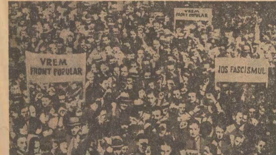
Aspect de la una din puternicele demonstrații din anul 1936, pentru făurirea unității clasei muncitoare, în sprijinul democrației, pentru Front popular, împotriva fascismului