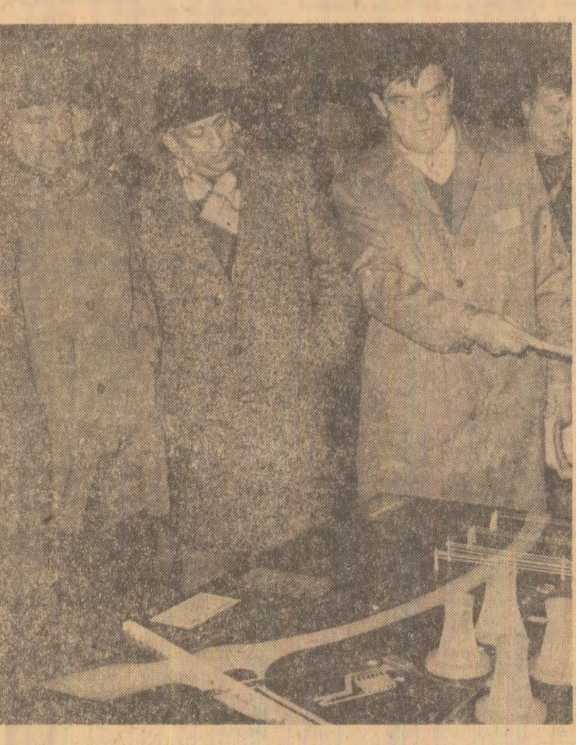
La termocentrala Rovinari sînt prezentate soluțiile de extindere și modernizare a acestei mari unități energetice

FILE DIN GLORIOASA CRONICĂ A LUPTEI POPORULUI ROMÂN PENTRU UNIRE, UNITATE ȘI INDEPENDENȚĂ NAȚIONALĂ, PENTRU FĂURIREA ȘI ÎNFLORIREA ROMÂNIEI SOCIALISTE PAGINA A IV-A