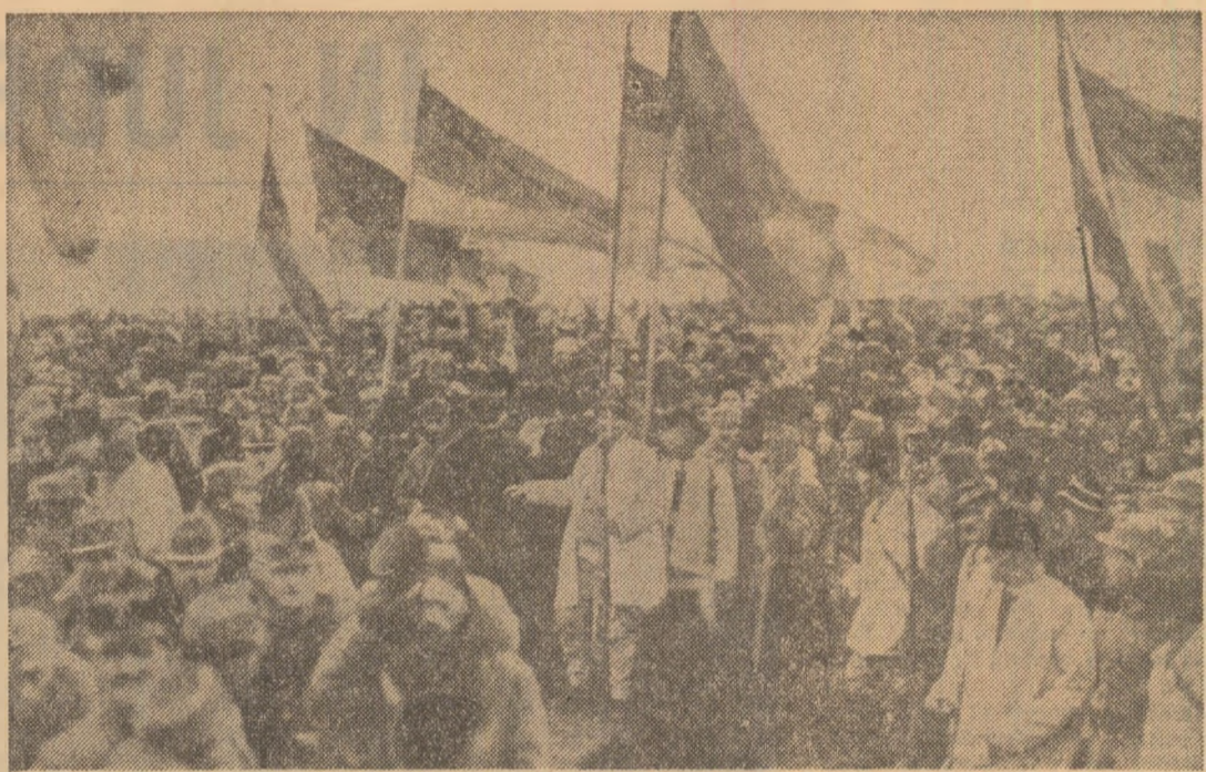
La Alba Iulia, pe Cimpul lui Horea: peste 100 000 de muncitori, țărani, cărturari, hotărând într-un singur gînd, într-o singură voință Unirea cu țara

ȘI O FIERBINTE ASPIRAȚIE EXPRESATĂ CHIAR ATUNCI, ÎN ZILELE UNIRII, care avea să se transpună, peste cîteva decenii, în realitatea luminoasă a zilelor noastre: „ROMÂNIA NOUĂ DE ASTĂZI TREBUIE SĂ DEVINĂ ROMÂNIA SOCIALISTĂ DE MÎINE!“