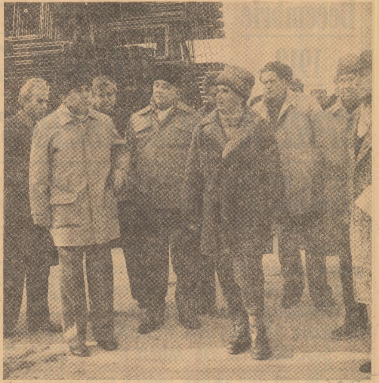
La centrala electrică de termoficare Craiova-II

În aceeași atmosferă vibrantă, entuziasată ca a marcat întâlnirile tovarășului Nicolae Ceaușescu cu oamenii muncii pe întreg parcursul