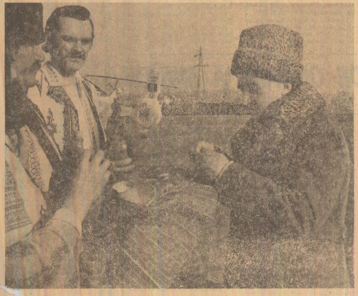
Secretarul general al partidului este întîmpinat la Ișalnița cu cele mai alese sentimente de stimă și respect

AU ÎNDEPLINIT PLANUL PE 11 LUNI Industria județului Alba Oamenii muncii din industria județului Alba raportează un nou succes în realizarea exemplară a sarcinilor de producție pe acest an. Acționînd cu hotărîre în direcția valorificării superioare a resurselor interne pentru creșterea productivității muncii, colectivele muncitorești din industria județului raportează îndeplinirea înainte de termen a planului pe 11 luni la producția-marfă, angajîndu-se să obțină pînă la sfîrșitul lunii o producție suplimentară în valoare de 921 milioane lei. Peste 95 la sută din această depășire se realizează pe seama creșterii productivității muncii. (Stefan Dînică).