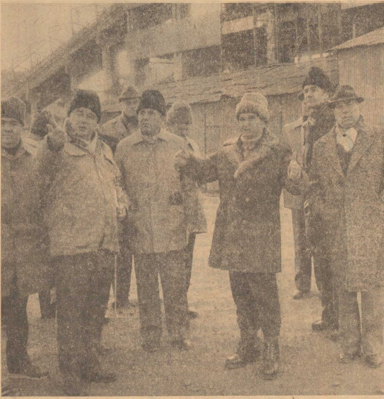
Dialog fructuos, de lucru, la termocentrala Turceni

Pe măsură ce s-a venit și aici, în număr mare, să-l salute cu dragoste și prețuire pe secretarul general al partidului, să exprime grațitudinea