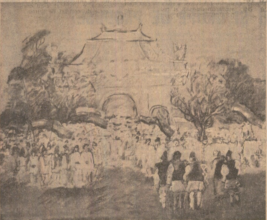
ALBA IULIA. Pictură de Dan Cristian