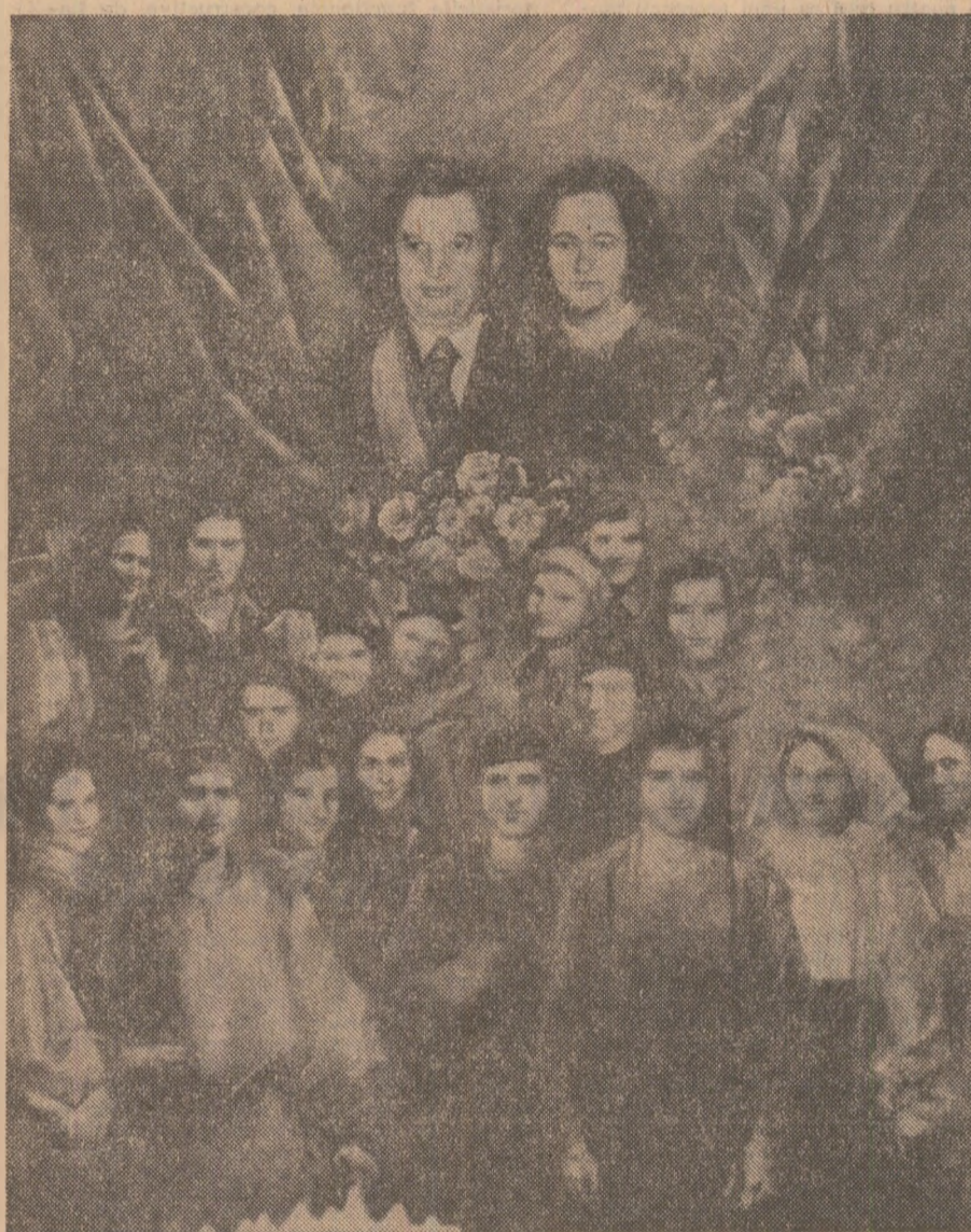
OMAGIU. Pictură de Cornel Brudășcu