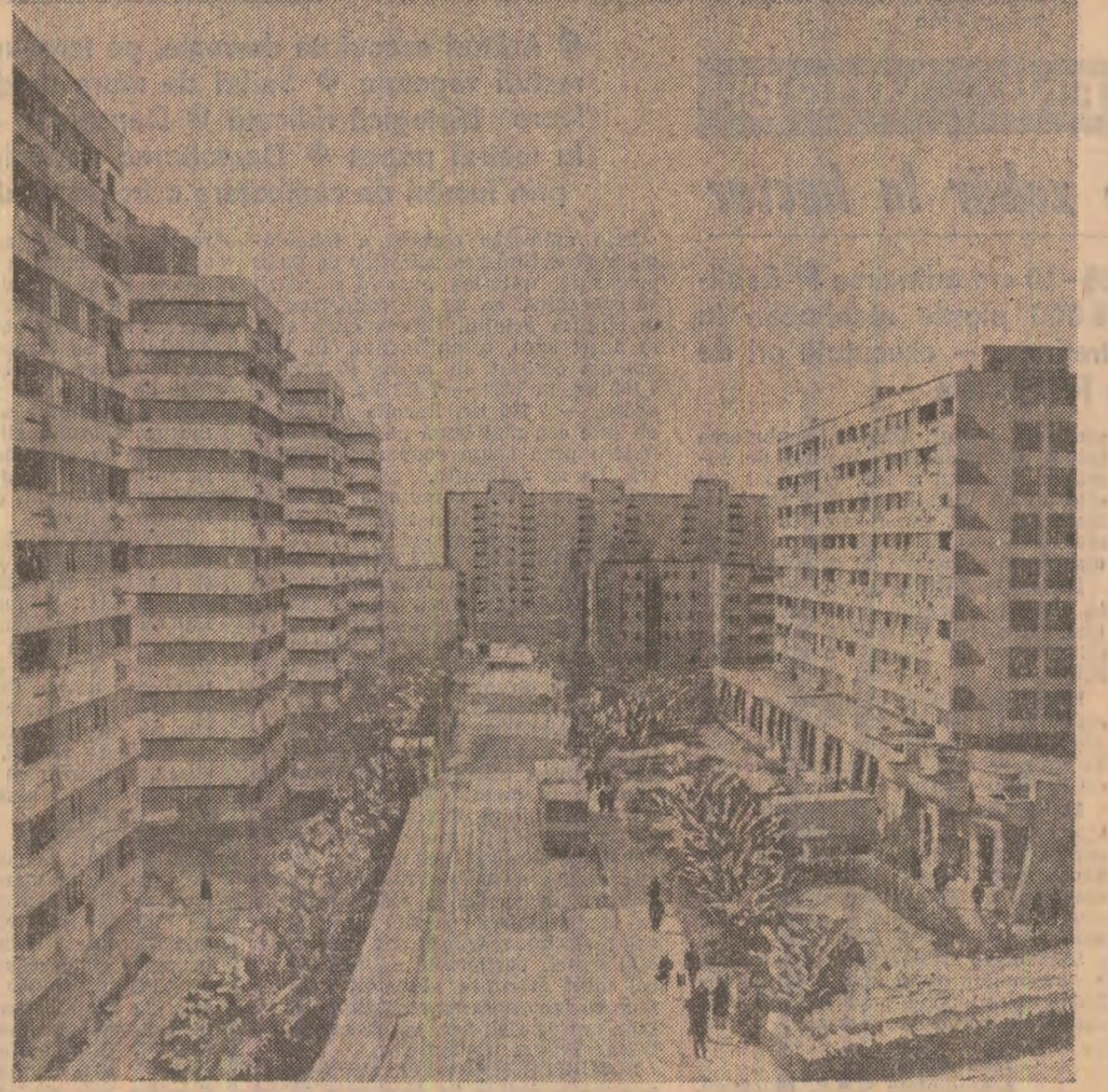
„9 Mai” — unul din noile și modernele cartiere ale municipiului Tirzului Jiu.

În geografia multiformă a Olteniei, Cotul lui Drac este un tablou distinct, cu accente particulare, în care peisajul se înscrie cu profunde note poetice. Într-adevăr, deslîșit de o minerie notabilă, împovărat de păduri bătrîne și grave ca niște cetăți verzi, văle dulci urmînd rîuri limpede și reci, munții din apropiere ce obliterează cerul albastru au modelat de-a lungul secolelor o gîndire armonioasă și cîteazătoare, un suflet generos deschis, sentimentelor înălțătoare și statornice. Răscolim nu de mult cîteva prețioase documente în care erau rememorate faetele de vitelie ale oamenilor de pe Jiu de sus și între altele mi-a reținut atenția o pagină de ficșă de locuitorii Tirzului Jiuului în octombrie 1916: atunci a tînut piept cetroștorului toată suflarea așezării, cită va fi fost formată din elevi, femei, bătrîni, bărbații tineri fiind plecați pe fronturile grele ale războiului mondial. În acei octombrie sînta începutul eroic Ecaterina Teodoroiu, și între amintirile documente am aflat și jurnalele liniere justitoare care conține a lăsa gînduri turbulente. Palatul istoric este în Gori pretutindeni viu și dînr-un năsemnat sentiment de venerare a trecutului s-a născut Tripticul,