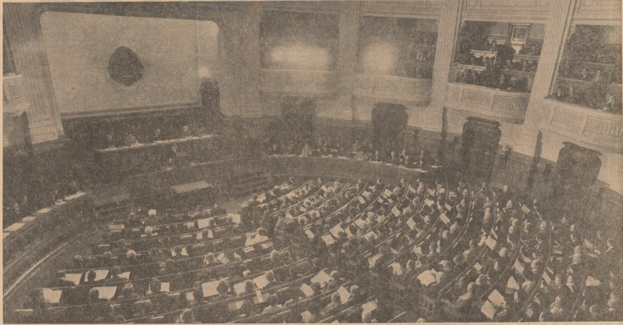
Realizarea bugetului de stat pe anul 1984, pentru aplicarea fermității resurselor în toate domeniile de activitate.

Prin muncă plină de abnegație și eroicizări noastre clase muncitoare, industria românească este capabilă să acopere cea mai mare parte din nevoile țării și să asigure mărfuri de înaltă calitate pentru export. Consiliul Suprem apreciază că volumul total al investițiilor, prevăzut pentru anul 1984, de 252 miliarde