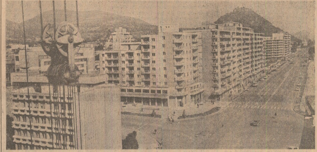
Arhitectură nouă de Devo

Întrevederea s-a desfășurat într-o atmosferă cordială, prietenască.