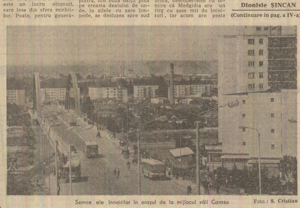
Semne ale înnoirilor în orașul de la mijlocul văii Carasu

Chel obișnuit, chel de granit. Insoțitorul meu — macaragiuul care asază biourile de piatră — se întreabă de ce mă mir atît. Nu-i pot explica pe îndelete de ce mă mir pentru că au trebuit să-i spun o poveste lungă, ar trebui să-i înfățișez o întreagă istorie, nu numai a locului de aici, ci a orașului întreg. Mă mulțumesc să mă mulțumesc: „Era o baltă aici!”, „Era — apasă el — și nu mai e. Foarte simplu!”. O fi foarte simplu pentru el, dar nu pentru cei de vîrstă mea. Sigur, era o baltă aici; iar mai sus, sub coasta văii, unde se rotește acum uriașele cutii toare ale combinatului de lianți și abociment, era cîmp, cîmp de piatră acoperite, de-o palmă, de țărînișă, înaltă de pînă la înaltul. Macaragiuul acesta tinăr era probabil scolar în clasa întîi cînd se ridicau zidurile combinatului. Și acum construiește noul port al Medgidiei la umărul Canalului Dunăre — Marea Neagră! Pentru anii Republicii, acest fapt este un lucru obișnuit, care iese din sfera mirărilor. Poate, pentru genera-