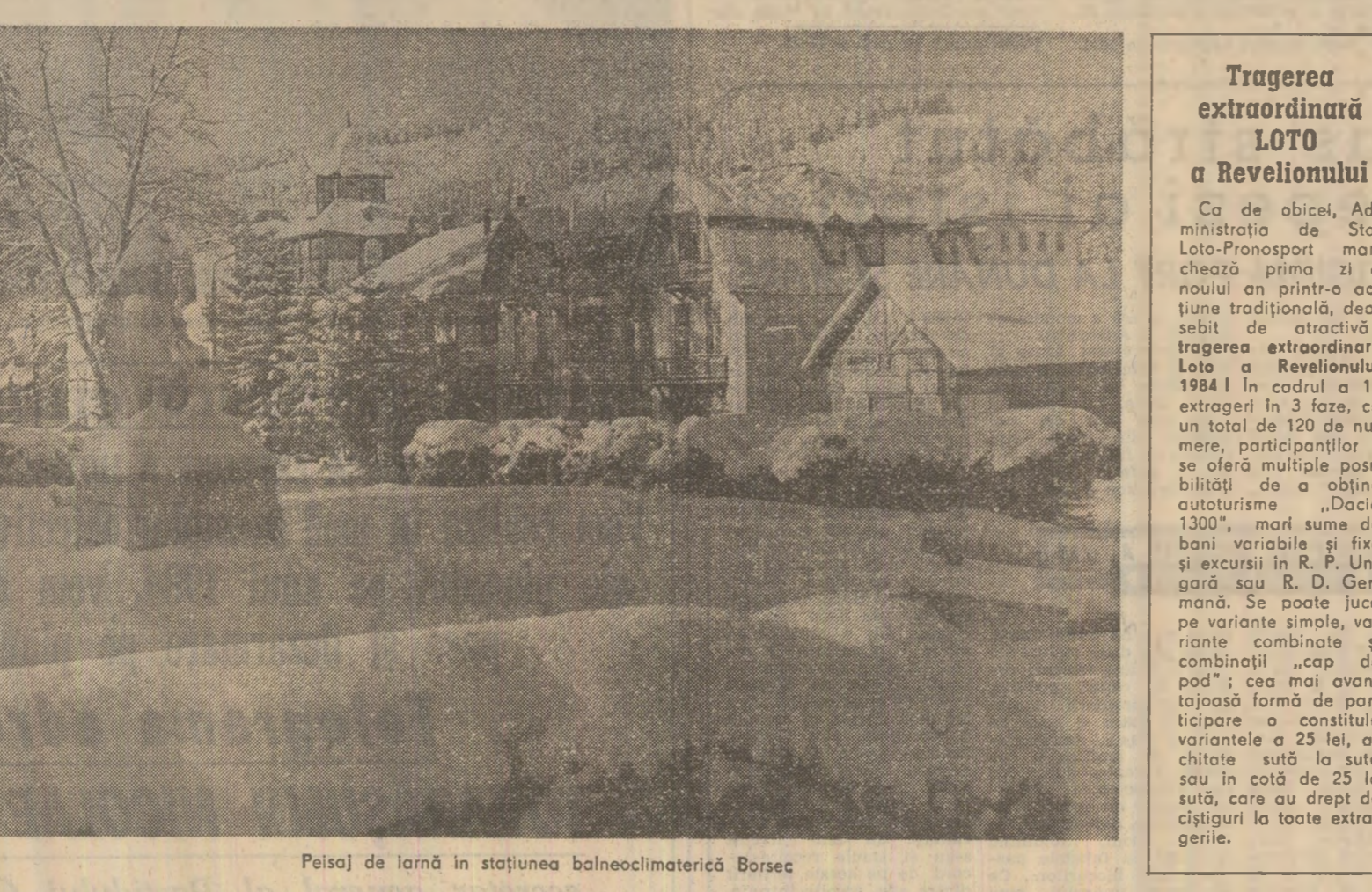
Peisaj de iarnă în stațiunea balneoclimaterică Borseac

Locuitorii din Guruleni — sat ce aparține de comuna Măgura-Teleorman — au semnalat că, de la