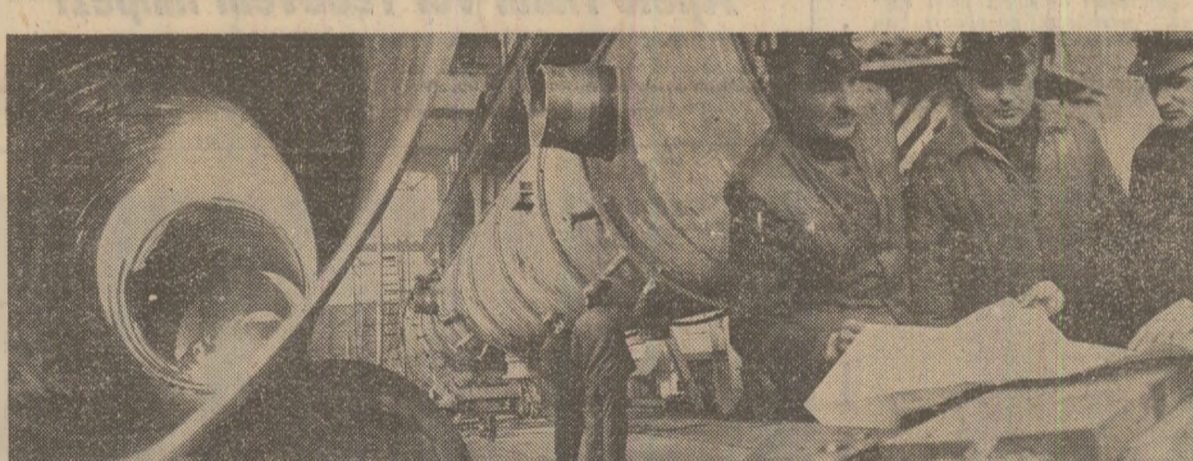
Moment de muncă la întreprinderea de utilaj chimic „Grivița roșie” — București

RĂSPUNS: În viața internațională s-a ajuns la o încordare deosebit de gravă. Se poate spune că, de la terminarea celui de-al doilea război mondial, niciodată situația nu a fost atît de gravă. Aceasta este rezultatul direct al intensificării cursei înarmărilor, în primul rînd a înarmărilor atomice, care, al adîncirii contradicțiilor pe plan internațional dintre diferite state și