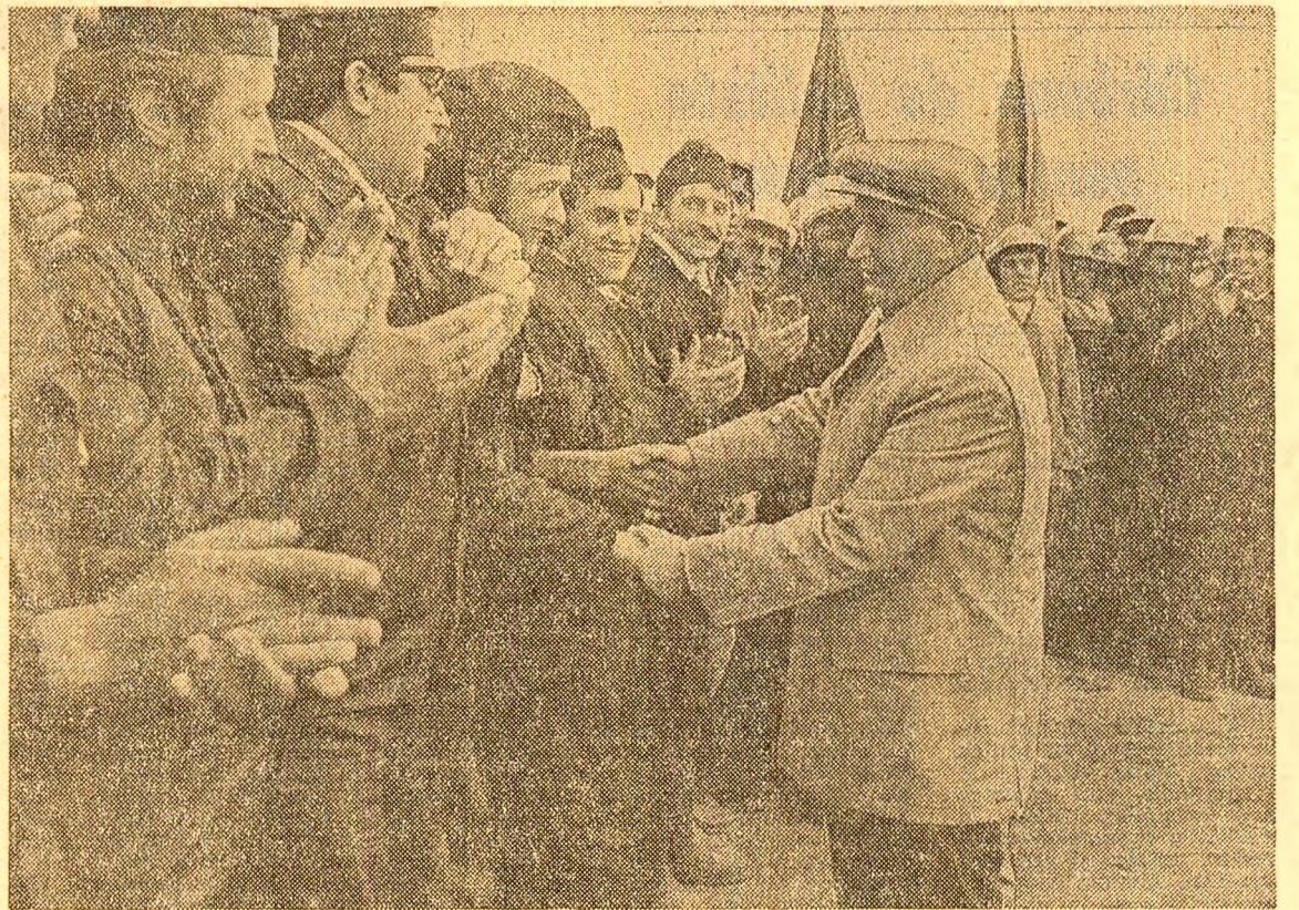
In cronică eroicilor ani al țării sînt păstrate nenumărate imagini emoționante ale întîlnirii tovarășului Nicolae Ceaușescu cu tinerii patriei