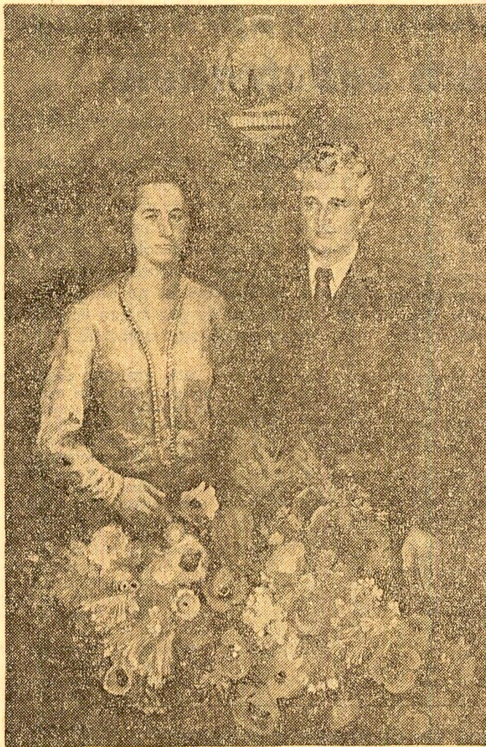
„SĂRBĂTOARE” Pictură de Maria Nemeș