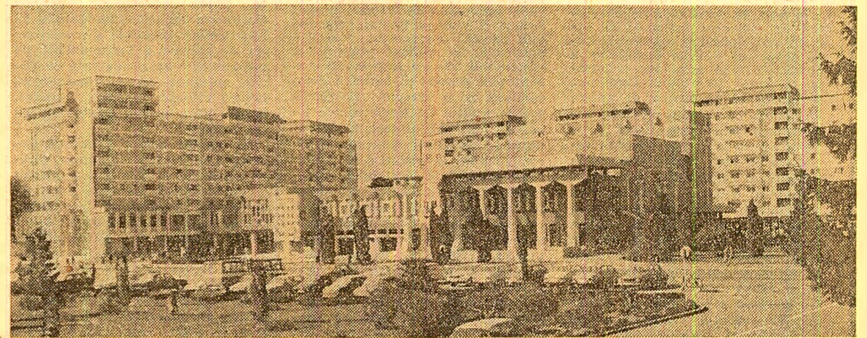
„Din noua arhitectură a orașului Român”