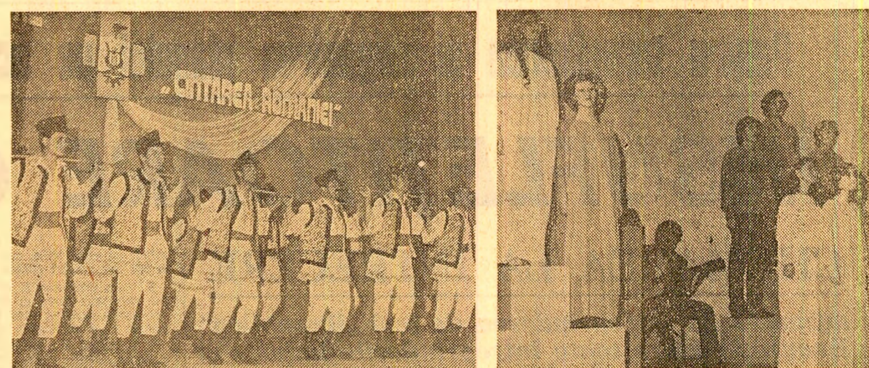
Doi dintre formațiile artistice gălățene, apreciate pentru evoluția lor în cadrul Festivalului național „Cintarea României”...

Expresie a democratismului artei noastre PROMOVAREA OPERELOR REPREZENTATIVE Opinii de Radu NEGRU