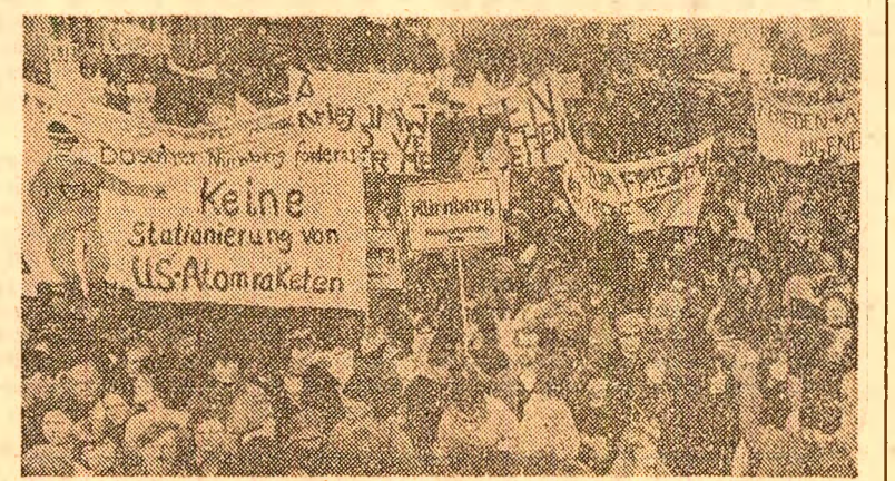
Aspect de la o recentă demonstrație a populației din Nürnberg împotriva instalării de rachete nucleare cu rază medie de acțiune pe teritoriul R.F. Germaniei