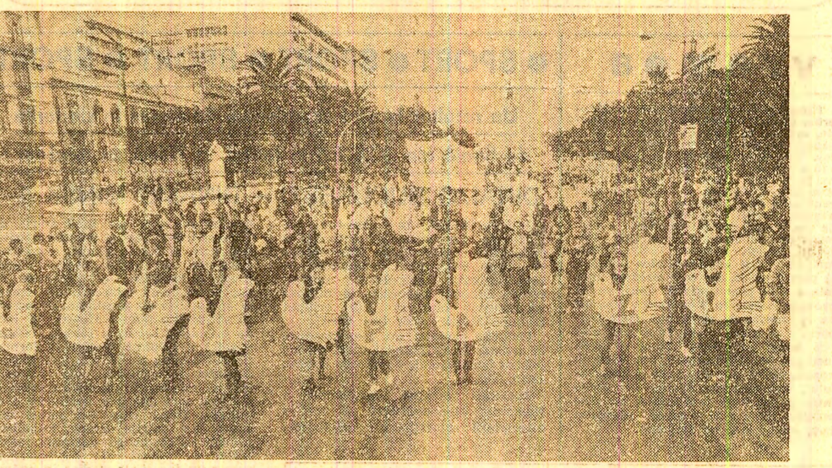
„PELA PAZI” (PENTRU PACE). Femeile portugheze au găsit această formă originală de a-și exprima hotărîrea ca, împreună cu femeile din întreaga lume, să facă totul pentru împiedicarea holocaustului nuclear

glasul împotriva armelor nucleare. Dar pînă la urmă a înțeles, ca și mulți alți cetățeni belgieni, că acum în joc este însuși viitorul omenirii, că un război nuclear poate duce la dispariția vieții de pe planeta noastră.