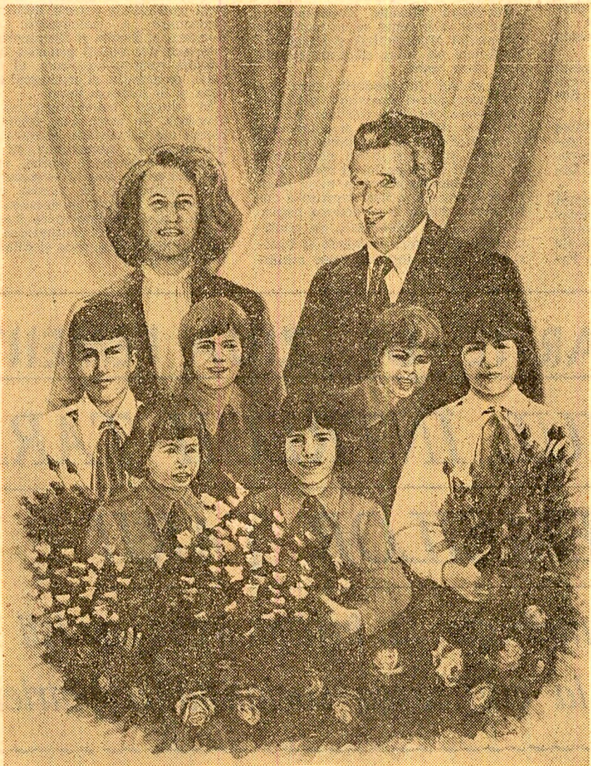
„OMAGIU” — pictură de Elisabeta Dorobăț