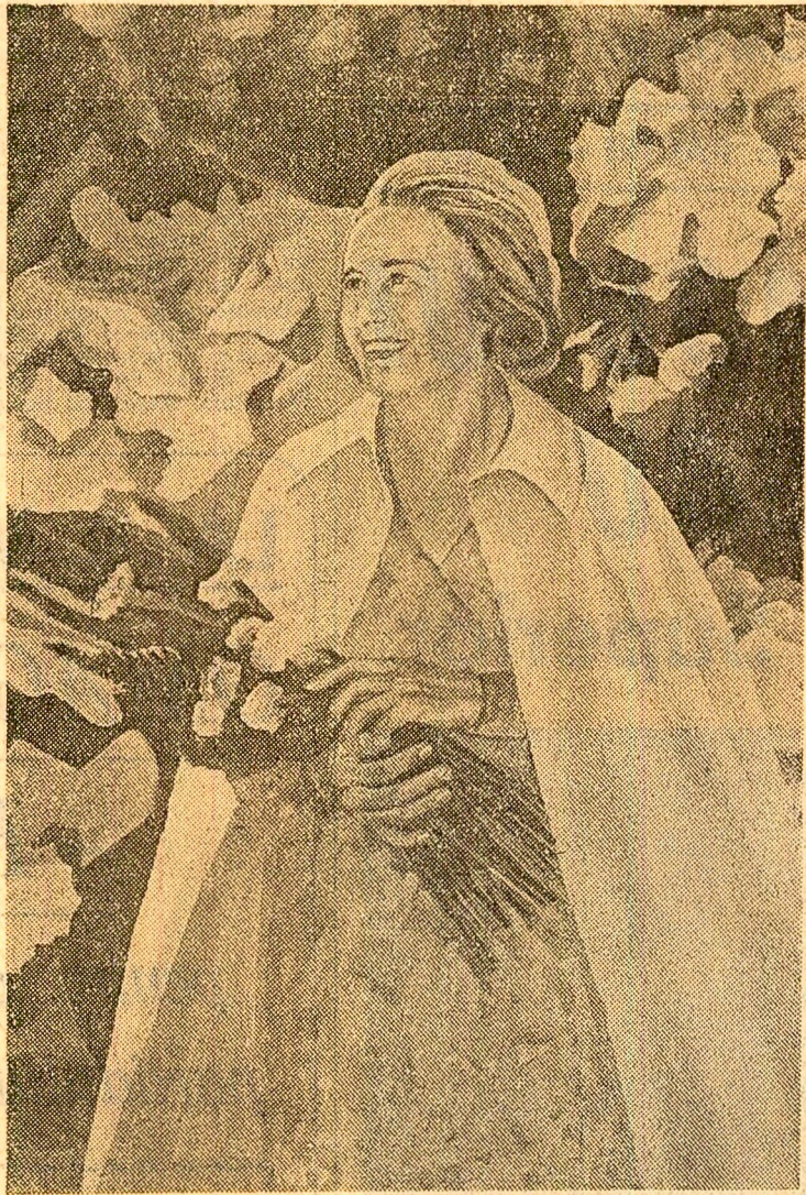
„PORTRETUL TOVARĂȘII ELENA CEAUȘESCU” — pictură de Cornelia Ionescu