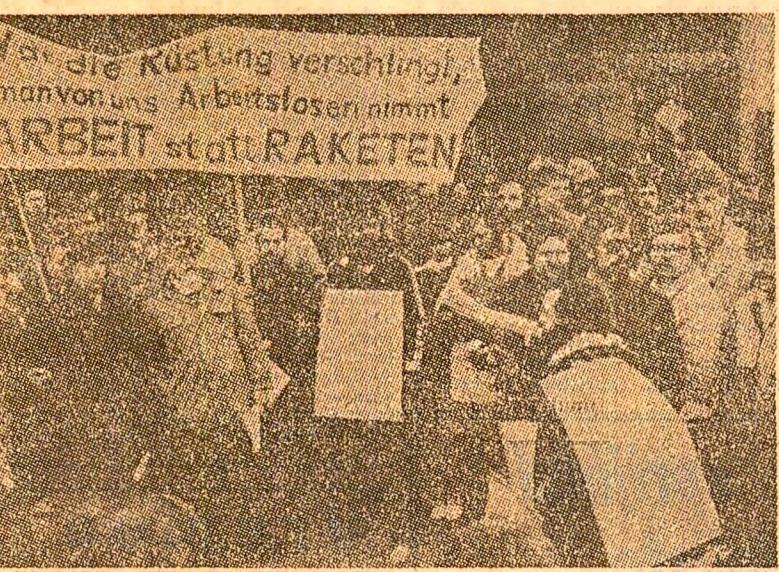
„Ceea ce înghite înarmările nu se răpește, șomerilor!” — scrie pe una din pancartele purtate de participanții la demonstrație desfășurată în orașul vest-german Essen...