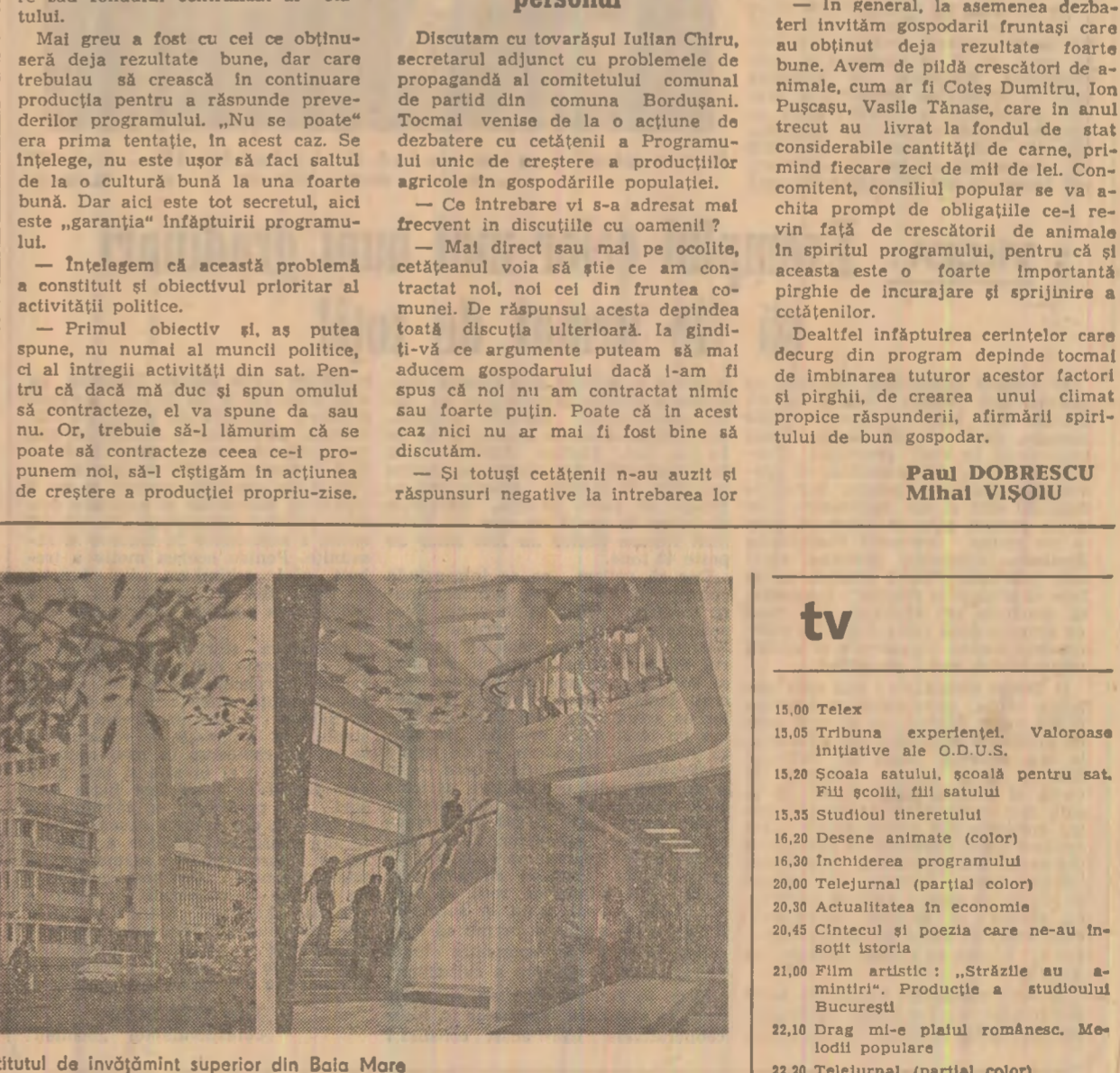
Institutul de învățămînt superior din Baia Mare