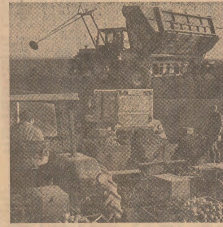
Plantarea cartofilor pe terenurile I.A.S. Carei, județul Satu Mare, se execută cu mașini de mare randament.