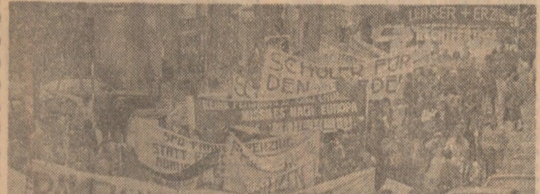
Milioniți pentru pace din Austria participă activ la ampla mișcare europeană împotriva sporiilor armelor nucleare. În clipșu a secvență de la o mare demonstrație împotriva cursei înarmărilor organizată de militanții pentru pace din Austria