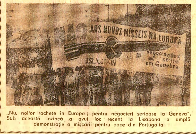
„Nu, noilor rachete în Europa; pentru negocieri serioase la Geneva.”