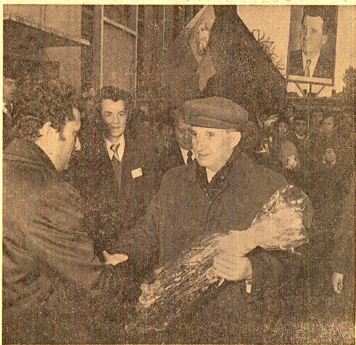
La Institutul național de motoare termice

Gazdele au relevat că, prin asimilările prevăzute, produsele noi