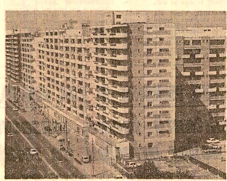
Noi locuințe în cartierul „Dunărea”, din Galați.