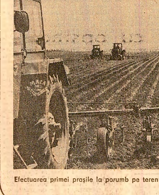
Efectuarea primei prașile la porumb pe terenurile C.A.P. Miroși, județul Argeș