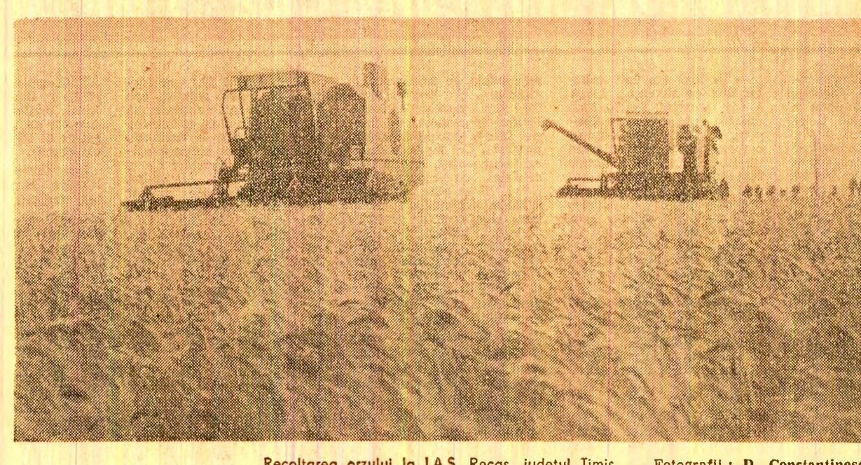
Recoltarea orzului la I.A.S. Recas, județul Timiș